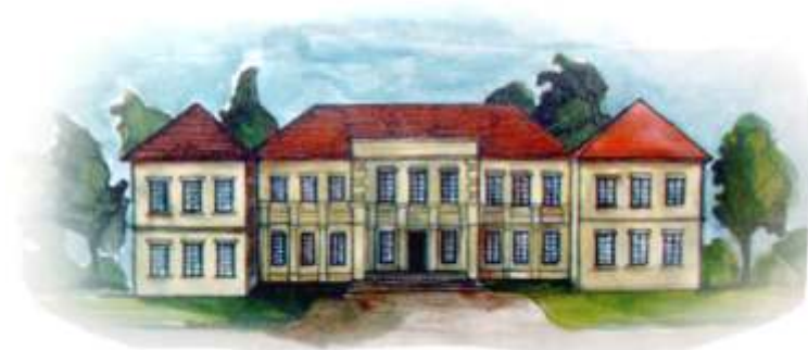
Rycina markuszowskiego pałacu. Ilustracja Kamila Bartuzi