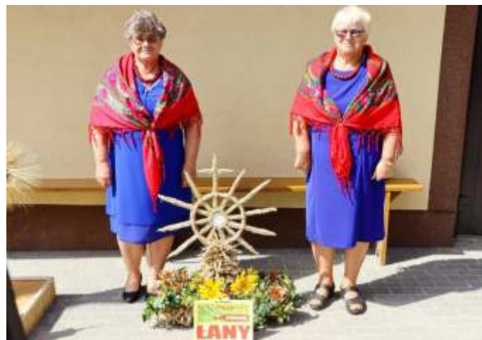
Przedświąteczne spotkanie na skwerku