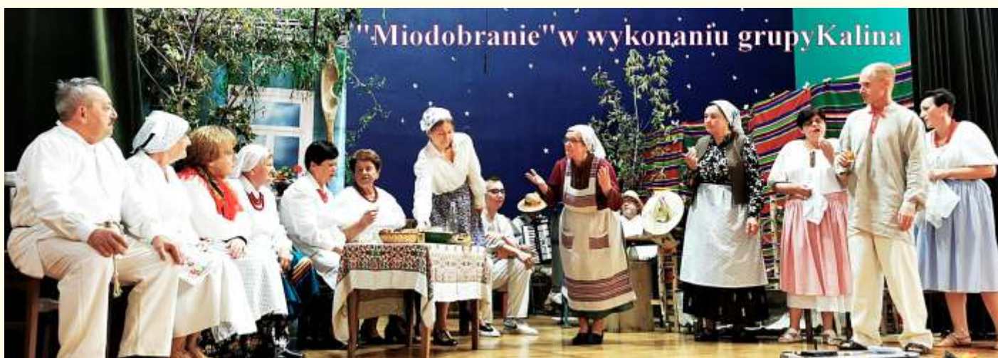
"Miodobranie" w wykonaniu grupy Kalina