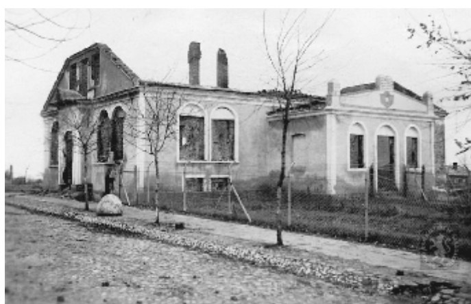
Żydowski, żydowski Dom Modlitwy (Bejt Tefila). Budynek został zburzony przez niemieckie samoloty 10 września 1939 r. Ciepło stało tam niecały rok Spółdzielczość

W niedzielne popołudnie znów słychać odgłos sztukasów - rozpoczyna się kolejny niemiecki nalot. Tym razem ma on charakter wyłącznie terrorystyczny, bo w Markuszowie nie ma już żadnych militarnych celów ani wojsk. Tłumy uciekinierów ostrzeliwane są z broni pokładowej atakujących samolotów, bomby spadają wszędzie, zaskoczeni ludzie nie spodziewali się kolejnego ataku. Tym razem bombardowane i ostrzeliwane jest nie tylko centrum, ale cały Markuszów. Na ziemi rozpętało się piekło, płoną wszystkie budynki, od bomb giną ludzie... Nie było się gdzie schować, nad miasteczko nadleciały kolejne fale bombowców, Markuszów płonął kilka dni... Łuna pożaru widoczna była z kilkunastu kilometrów.