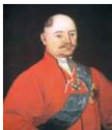
Kajetan Hryniewiecki wojewoda lubelski w latach 1782–1795.

Na fotografii z lat 30. XX w. możemy w tle rodzinnego zdjęcia mieszkańców Markuszowa, zobaczyć oficynę kuchenną pałacu Hryniewieckich. Budynek wraz z okolicznymi stawami należał w tym czasie do rodziny Broniewskich – przemysłowców z Garbowa. Zdjęcie markuszowskiej oficyny można również było zobaczyć w Tygodniku Ilustrowanym z 1939 r. (nr 11 s. 209.). Późniejsze zdjęcie z przełomu lat 40/50. XX w. ukazuje nam ten sam budynek, ale już w postaci zniszczonej ruiny.