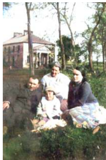
Widok oficyny kuchennej w latach 30. XX w.

Na fotografii z lat 30. XX w. możemy w tle rodzinnego zdjęcia mieszkańców Markuszowa, zobaczyć oficynę kuchenną pałacu Hryniewieckich. Budynek wraz z okolicznymi stawami należał w tym czasie do rodziny Broniewskich – przemysłowców z Garbowa. Zdjęcie markuszowskiej oficyny można również było zobaczyć w Tygodniku Ilustrowanym z 1939 r. (nr 11 s. 209.). Późniejsze zdjęcie z przełomu lat 40/50. XX w. ukazuje nam ten sam budynek, ale już w postaci zniszczonej ruiny.