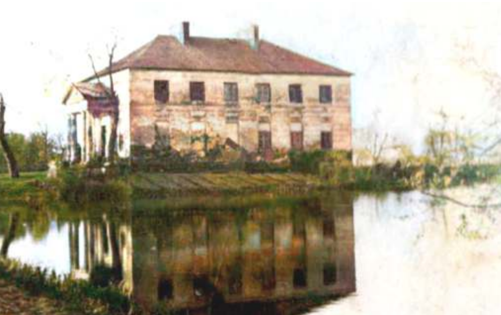
Klasycyistyczna oficyna kuchenna dawnego pałacu w Markuszowie w okresie międzywojennym.

Stare fotografie, choć czasem zniszczone i niewyraźne, często pokazują miejsca które dzisiaj już nie istnieją, ale kiedyś tętniły życiem i związane są z nimi ciekawe wydarzenia.