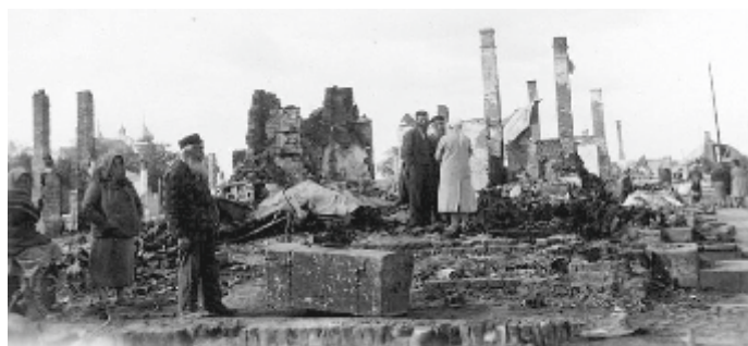
Żydzi stoją w ruinach swoich domów zburzonych 10 września. W głębi widoczny kościół parafialny św. Ducha. Markuszów został doszczętnie zniszczony, po bombardowaniu 10 września. Zdjęcie zrobił Niemiec w piątek 15 września 1939 r.