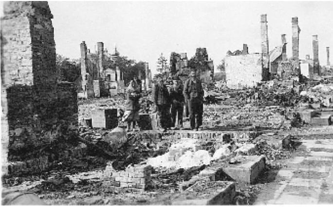
Żyła ścieżka w ruinach swoich domów zburzonych przez Niemców.

Po wkroczeniu wojsk niemieckich do Lublina w 1939 r. rozpoczęły się masowe prześladowania ludności żydowskiej. Dwa lata później w 1941 roku utworzono getto na terenie miasta żydowskiego na podzamczu. Uwięziono w nim ponad 34 tysiące Żydów. Na Majdanku powstał obóz masowej zagłady. Ostatecznie śmierć poniosło tam ok. 78 tysięcy Żydów.