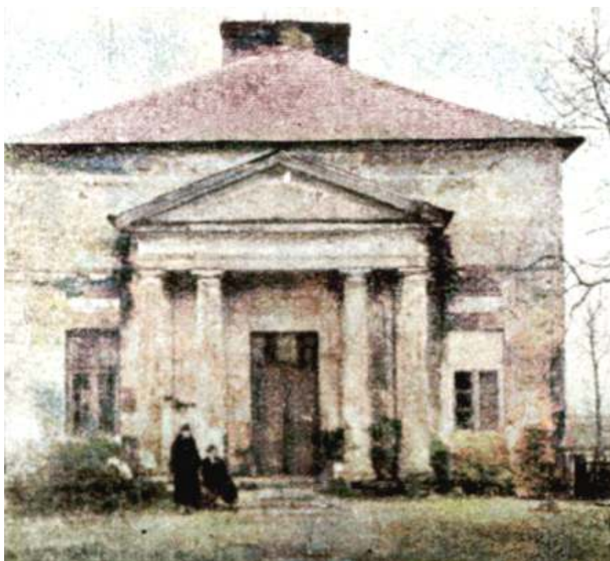
Reprodukcja fotografii markuszowskiej oficyny z Tygodnika Ilustrowanego z 1939 r.