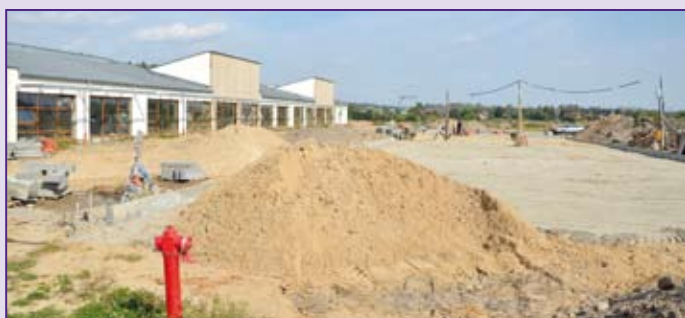
Parking przy przedszkolu pomieści około 40 aut

Tylko miesiące dzielą nas od zakończenia budowy przedszkola w Niemcach. Obiekt z dnia na dzień nabiera coraz wyraźniejszych kształtów.