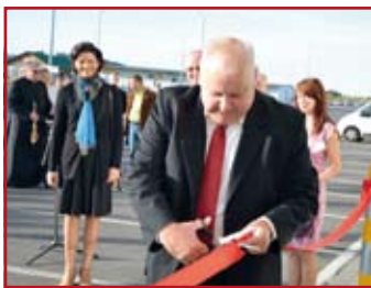
Pozwólcie, że skończę to, co zacząłem – powiedział Prezes Rynku Hurtowego w . Elizówce. Przeciął wstęgę i tym samym oficjalnie otworzył nową halę