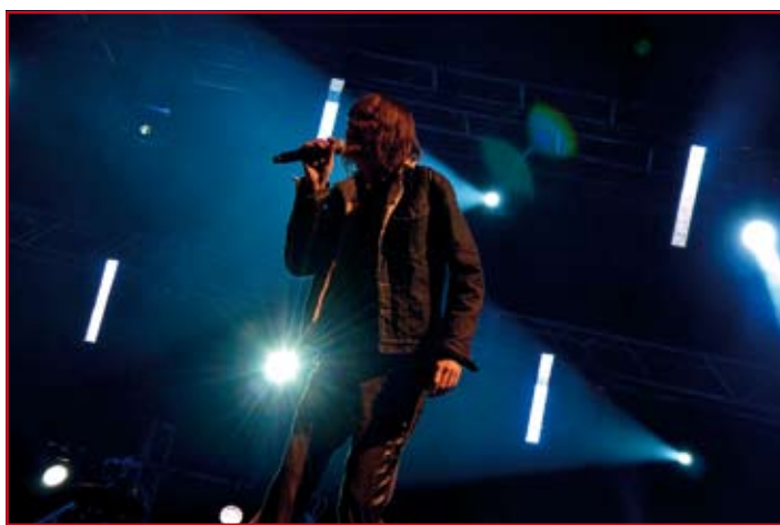
Na koncert Wilków przyjechały setki fanów. Robert Gawliński zaśpiewał największe przeboje grupy.

Po godzinie dziewiętnastej rozpoczął się koncert gwiazdy wieczoru – zespołu Wilki. Robert Gawliński z muzykami zagrali i zaśpiewali swoje największe przeboje. „Baśkę”, „Lecę, bo chcę”, „Sid i Nancy” oraz „Beze mnie o mnie” - te utwory razem z grupą śpiewali niemalże wszyscy fani.