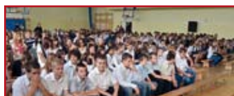
Rozpoczęcie roku szkolnego w Zespole Szkół w Niemcach podzielone było na dwie części. Wcześniej szkołę po wakacjach przywitali gimnazjaliści