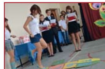
Gra w klasy to według gimnazjalistów zabawa już niemalże zapomniana