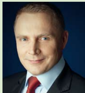
Henryk Smolarz, Poseł na Sejm RP Mam prośbę do Mieszkańców

Chcę też Państwu powiedzieć, że chcielibyśmy kontynuować tę inwestycję. Szukamy pieniędzy na remont skrzyżowania na drodze nr 809 w Krasieninie.