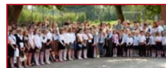
Pierwszy dzień roku szkolnego był ciepły i słoneczny dlatego dyrektorka Zespołu Szkół w Krasieninie zdecydowała się na uroczystość na dworze.