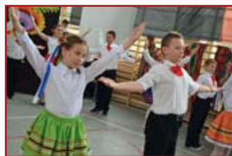
- Swoje umiejętności taneczne zaprezentowały także dzieci tańczące tańce ludowe