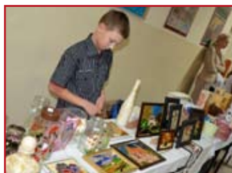
Podczas EDD można było kupić rzeczy zrobione przez uczniów Zespołu Szkół i Stowarzyszenie im. I. Kosmowskiej

Lokalną historię, kulturę, obrzędy, tradycje i zabawy ocalali od zapomnienia także uczniowie Zespołu Szkół im. Ireny Kosmowskiej w Krasieninie. 14 września w szkole odbyły się oficjalne uroczystości dotyczące EDD. Młodzi historycy zaprosili Andrzeja Nowickiego, który razem z żoną prowadzi w Nasutowie gospodarstwo agroturystyczne