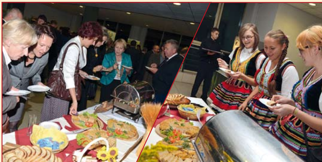
Stoisko Gminy Niemce oraz zaprzyjaźnionych firm cieszyło się ogromnym zainteresowaniem

Dom Nasutów i Ciastkarnia Alicja z Nasutowa oraz firma DysPol z Dysa zaprezentowały się na Europejskim Kongresie Dyrektorów Szkół Zawodowych w Lublinie. Swoje stoisko miała też Gmina Niemce.