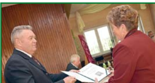
Podziękowania za udział w Dożynkach Gminnych 2012 otrzymały wszystkie delegacje, które brały udział w Korowodzie Dożynkowym

Następne spotkanie zostało wstępnie ustalone na październik. (er)