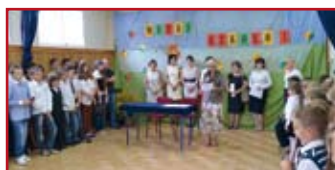
W Szkole Podstawowej w Rudce Kozłowieckiej rok szkolny rozpoczęło 76 uczniów. Wszyscy uśmiechnięci i zadowoleni