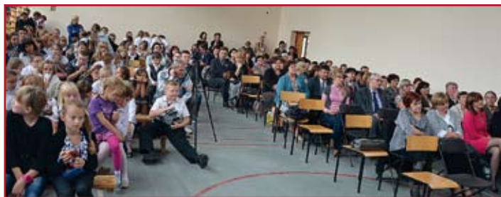
Europejskie Dni Dziedzictwa cieszą się w Krasieninie zainteresowaniem. Przedstawienie młodzieży obejrzało sporo osób

Takie hasło przyświecało uczniom Zespołu Szkół w Krasieninie, którzy brali udział w organizacji tegorocznych Europejskich Dni Dziedzictwa. Impreza wrosła już w kalendarz szkoły. Odbyła się po raz piąty.