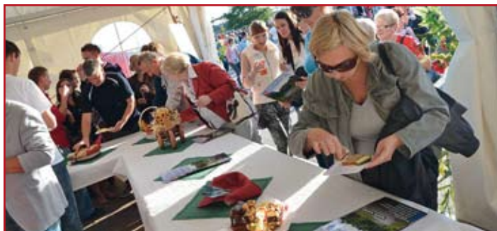
Stoisko Gminy Niemce cieszyło się dużym powodzeniem wśród odwiedzających Owocobranie

Grupa Wilki była gwiazdą tegorocznego Owocobrania w Elizówce. Czwarta edycja Ogólnopolskiego Święta Producentów Owoców i Warzyw odbyła się 9 września. Swoje stoisko zaprezentowała także Gmina Niemce.