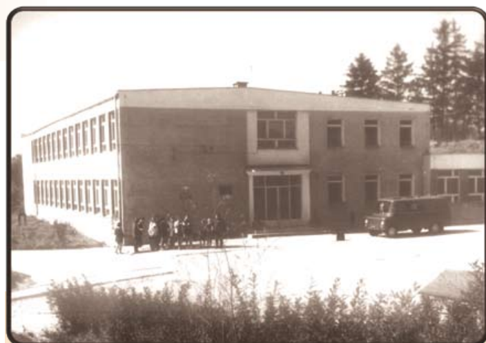
Budynek szkolny w latach 70-tych