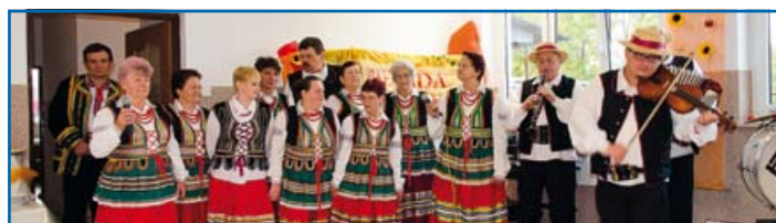
Dysowiacy zawsze chętnie uczestniczą w biesiadach w Jabłoni. Ważną rolę odgrywa tu wioletrni przyjaźń z gospodarzami - zespołem Kalina