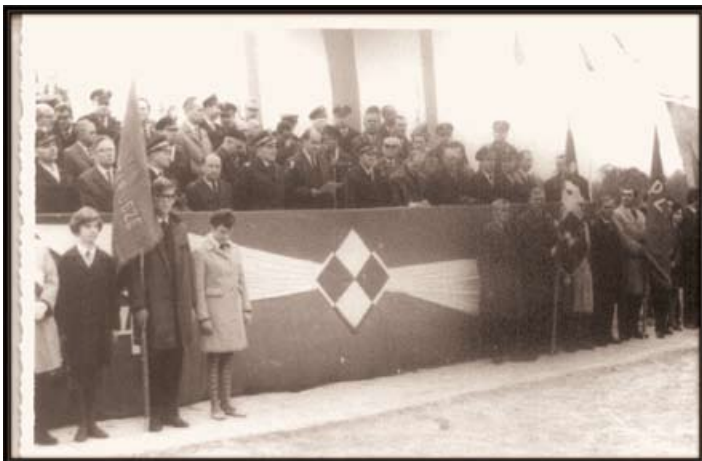
Odsłonięcie pomnika ku czci Lotników Polskich w 1965 roku