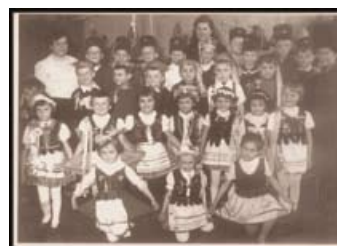
Występ dzieci 1964 rok