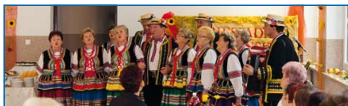
Zespół Kalina z Jabłonia