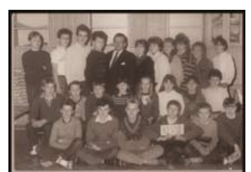
Klasa VIII z dyrektorem szkoły - rok 1989-1990