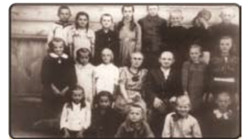
Początek lat 50-tych XX wieku