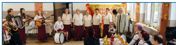
Zespół z Kolana