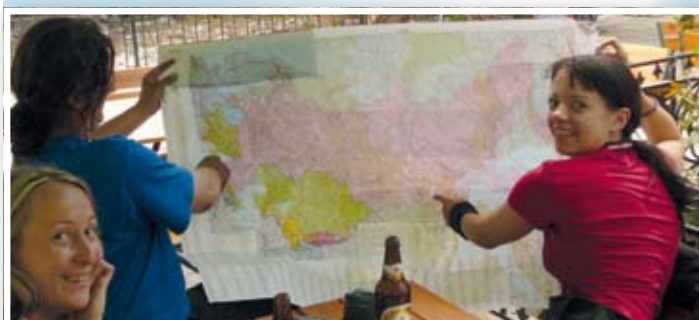
Obiad na Krymie w cieniu prawosławnej cerkwi. Droga przed nami jeszcze daleka.