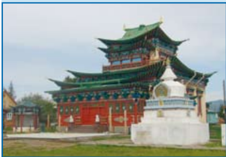
Iwołgińsk, niewielka wioska oddalona o 30 km od Ulaan Ude, to centrum rosyjskiego buddyzmu. Tutejszy dacan (datsan), czyli uniwersytet-klasztor, składa się z czterech świątyń, licznych stup, biblioteki, muzeum sztuki buriackiej, domu lamów, hotelu i części uniwersyteckiej.