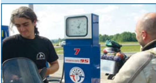
Tak wyglądają rosyjskie dystrybutory na stacjach benzynowych :)

Niebieskie szarfy modlitewne, na stałe wtopione w mongolski krajobraz, powiewając na wietrze odpędzają demony. Wieszane są na znakach przydrożnych, a przede wszystkim na każdym kopcu owoo, najczęściej usypywanym z kamieni lub ułożonym z drewnianych palików i gałęzi. Przy owoo składa się różne ofiary: pieniądze, alkohol, wodę, mleko. Owoo to swoisty rodzaj przydrożnej kapliczki i jednocześnie magicznego miejsca obrzędów ku wybranym duchom z całego panteonu duchów niższych i wyższych. Przez buddyjskich lamów odprawiane są przy owoo obrzędy wypędzania złych duchów i chorób lub obrzędy błagalne o pomnożenie stada bydła, dobrą pogodę, ochronę okolicy lub opiekę nad podróżnymi.