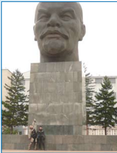
Pomnik Włodzimierza Iljicza Lenina w Ulaan Ude. Wysokość cokołu wynosi 6,3 metra, wysokość samej głowy Lenina to 7,7 metra. Motywem wzniesienia pomnika była chęć uczczenia, przypadającej w 1970 roku, setnej rocznicy urodzin wodza przewrotu październikowego.