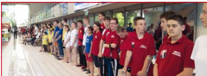
Letnie Mistrzostwa Polski w pływaniu Defilada uczestników