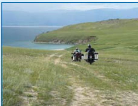
Wyspa Olchon na Bajkale. Olchon to, przede wszystkim, święte miejsce Buriatów, które jako jedno z pięciu na Ziemi posiada magiczną, szamańską energię. Dziesiątki miejsc kultu wyznaczają drzewa i drewniane pale zwane „serge” obwiązane kolorowymi wstążkami i leżącymi pod nimi setkami darów w formie pieniędzy, papierosów, czy butelek wódki. Każdy Buriat sięgając po kieliszek alkoholu najpierw moczy w nim serdeczny palec lewej ręki i bryzga wódką na cztery strony świata. W ten sposób oddaje cześć czterem boskim żywiołom.