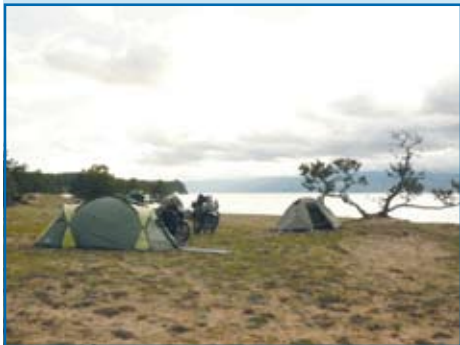
Nasz kemping w malowniczym miejscu na wyspie Olchon na Bajkale.