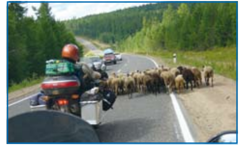
Rosja i mała przeszkoda. W pobliżu nie było widać pasterza. Wszyscy zwalniali widząc stado, dlatego owce czuły się bezpiecznie i nie zamierzały szybko opuścić asfaltowej drogi.