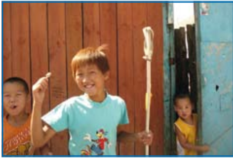
Ulaan Bator. Motocykl wszędzie wzbudzał żywe zainteresowanie i uśmiech.