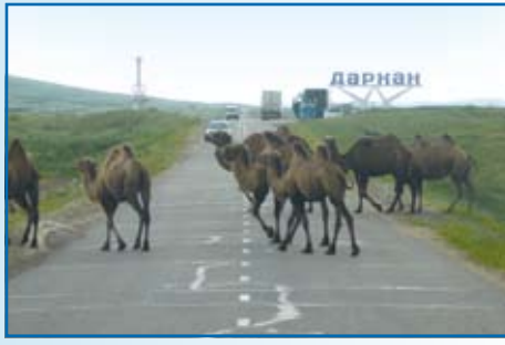
Mongolia. Widok stada wielbłądów przecinających jedyną asfaltową drogę (biegnącą od granicy z Rosją do stolicy - Ulaan Bator).