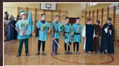
Uczniowie z Nasutowa w scenkach rodzajowych zaprezentowali ucztę rycerską