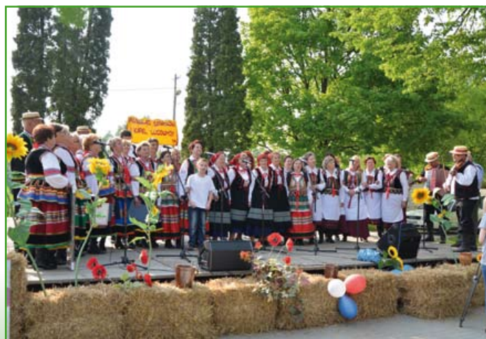
Przegląd zakończył się wspólnym odśpiewaniem popularnej piosenki pt. „Szła dziewczeczka do laseczka”