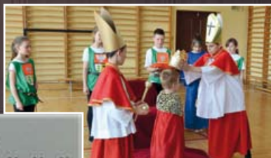
Koronacja króla – uczniowie z Niemiec bardzo wiernie przedstawili scenkę