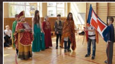
Zadaniem drużyny z Dysa było zainscenizowanie hołdu lennego