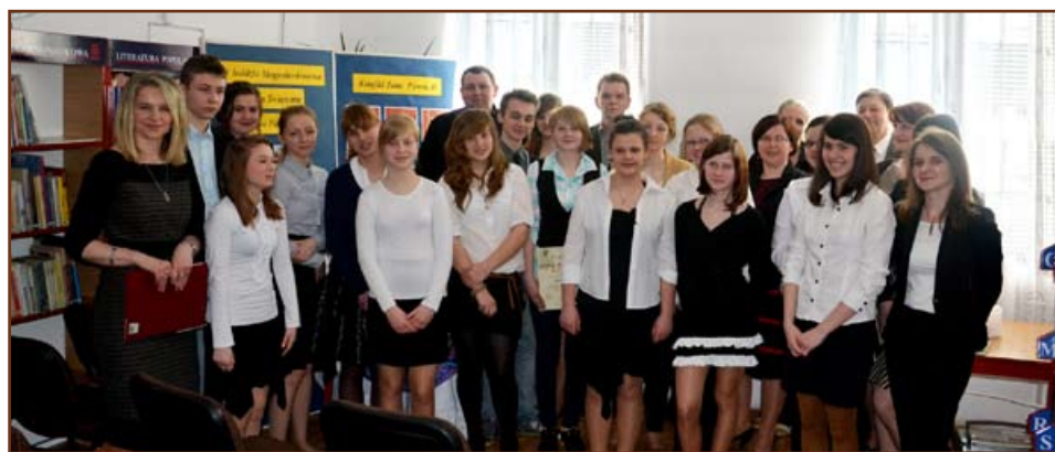
W konkursie udział wzięło 16 uczestników