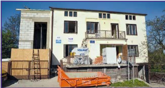
Remont Ośrodka Zdrowia trwa już ponad miesiąc Tak będzie wyglądała nowa klatka schodowa

Największym i wymagającym najwięcej nakładów pracy i czasu przedsięwzięciem jest kapitalny remont Ośrodka Zdrowia w Krasieninie. Budynek zmieni się nie do poznania. W miejscu starej i zniszczonej klatki schodowej powstanie nowa, solidna i estetyczna. Obiekt zostanie ocieplony, wymieniona będzie stolarka okienna, drzwiowa i dachowa. Nowością będzie winda, która zostanie przystosowana do potrzeb osób niepełnosprawnych.