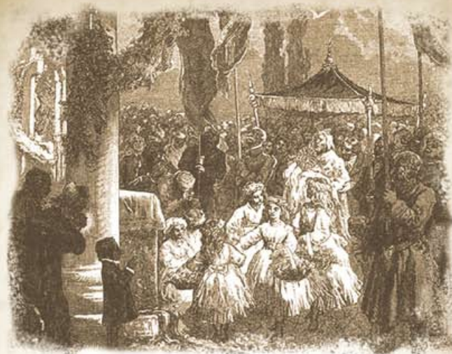
Procesja Bożego Ciała rys. Michała Elwiro Androlli

Ktoś, kto nie zdołał w porę dopchać się i zdobyć kawałek gałązki lub kwiatka z ołtarza miał jeszcze okazję w oktawę Bożego Ciała. Święcono wtedy wianki z niezapominajek, rosiczek, kopytników, macierzanek, mięt, bławatków, żeby mieć je na czas zarazy, choroby czy niepogody. Wieszano