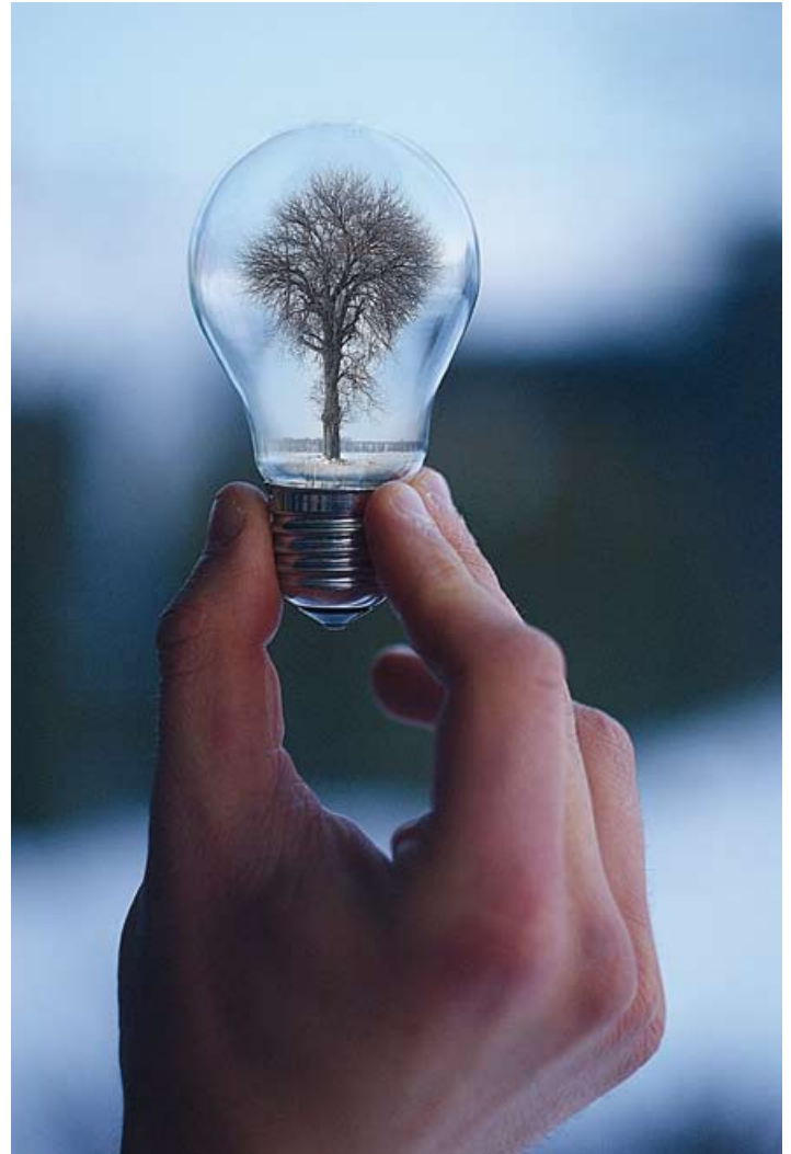
Praca konkursowa Fot. Agata Mroczek

Jeszcze nie wie, czy swoją przyszłość zwiąże z fotografią. – Zastanawiam się nad tym cały czas, ale jest to trudna decyzja. Muszę zobaczyć w jakim kierunku potoczy się moja „twórczość” – zaznacza.