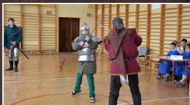
Pokazy walk do tego stopnia spodobały się uczniom, że sami chętnie brali w nich udział