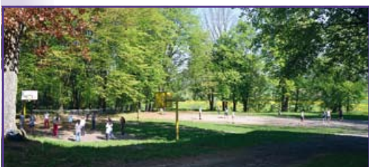
Budowa boiska rozpocznie się lada dzień

Nowoczesne boisko wielofunkcyjne będą mieli do dyspozycji uczniowie Zespołu Placówek Oświatowych w Ciecierzynie. Inwestycja niedługo się rozpocznie.