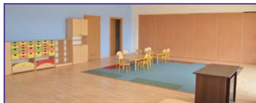
Już od czerwca dzieci będą się bawić w takich salach W nowym przedszkolu będzie możliwość, by prosto z sali wyjść na plac zabaw

Niestety – ze względów bezpieczeństwa przedłużono się oddanie budynku do użytku. Było to wynikiem niedociągnięć wykonawcy w trakcie inwestycji.