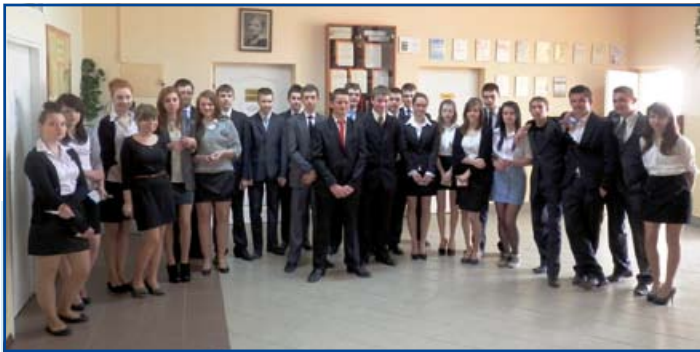
Uczniowie ZS w Krasieninie

Trzy kwietniowe dni w całej Polsce trwał egzamin gimnazjalny. Uczniowie musieli wykazać się wiedzą z zagadnień humanistycznych, przyrodniczych, matematycznych oraz języków obcych. W naszej gminie do sprawdzianu przystąpiło 160 uczniów uczęszczających do trzech gimnazjów.