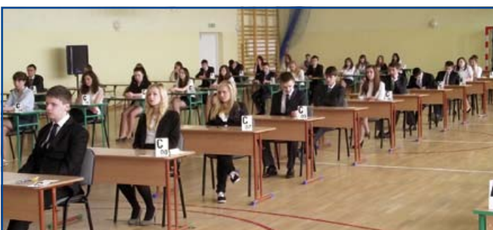
Egzamin Gimnazjalny w ZS w Niemczech

W tym roku egzamin gimnazjalny uczniowie zdawali w dniach 23–25 kwietnia. Przystąpienie do niego jest warunkiem ukończenia gimnazjum, a jego wyniki w dużej mierze decydują o powodzeniu dostania się do wymarzonej szkoły ponadgimnazjalnej. (er)