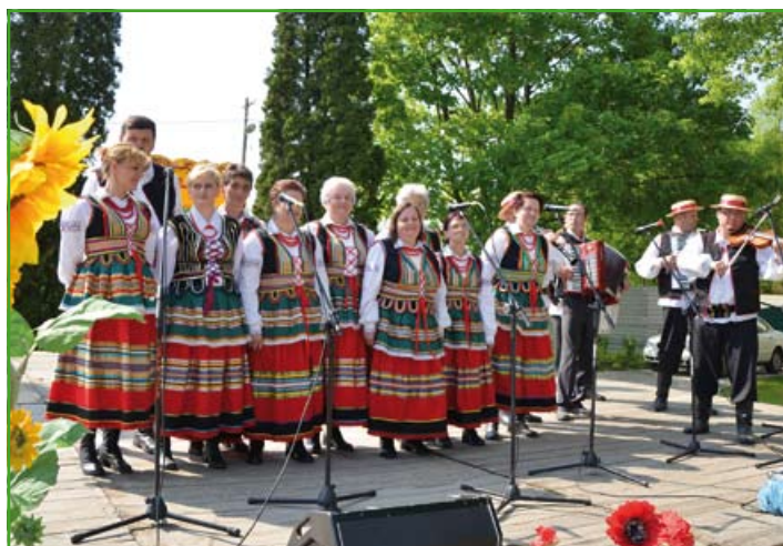
Zespół Dysowiaci już po raz kolejny gościł w swojej miejscowości inne zespoły ludowe z regionu