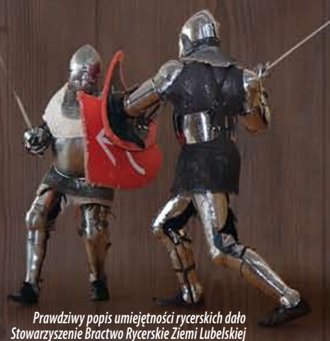
Prawdziwy popis umiejętności rycerskich dało Stowarzyszenie Bractwo Rycerskie Ziemi Lubelskiej

Sześć klas piątych ze szkół podstawowych z gminy Niemce wzięło udział w I Gminnym Turnieju Rycerskim Klas V. To kolejna impreza międzyszkolna pod patronatem Wójta Gminy Niemce, która ma szansę zapisać się już na stałe w kalendarzu.