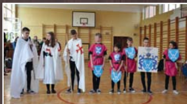
Herb uczniów z Rudki Kozłowieckiej najbardziej przypadł do gustu Jury