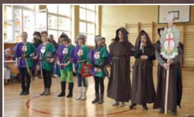
Drużyna z Ciecierzyna zaprezentowała się jako pierwsza