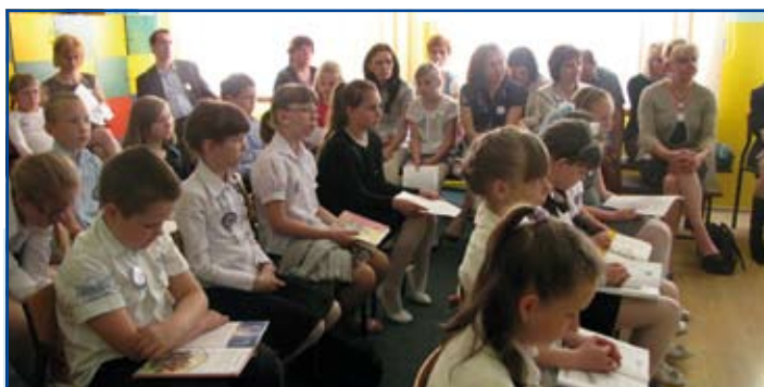
Po raz IX miłośnicy literatury klas młodszych spotkali się na Konkursie Pięknego Czytania

Konkurs od lat cieszy się dużą popularnością wśród uczniów klas młodszych. W rywalizacji o laur najlepszego interpretatora prozy wzięło udział 23 uczestników, prezentujących wysoki poziom umiejętności.