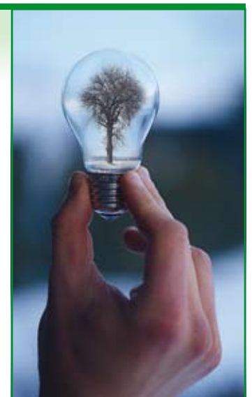
Praca konkursowa

w sposób niebanalny. Chciałam zwrócić uwagę na fakt, że młodzi ludzie również angażują się w akcje proekologiczne. Zdjęcia nawiązują do problematyki ochrony środowiska, pokazują zaangażowanie w ten proces wielu ludzi. Są również zachętą do tego, aby człowiek odpoczął przez godzinę razem z Ziemią.