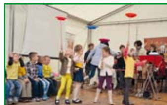
Dzieci z przedszkola w Nasutowie dały niezły popis akrobacji