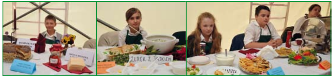
Tuż przed degustacją potraw...

Wszyscy uczestnicy konkursu otrzymali pamiątkowe dyplomy i fartuszki z logo konkursu, laureaci otrzymali dyplomy i nagrody w postaci tablettów.