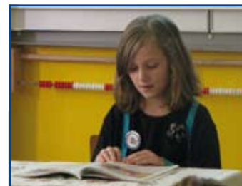
Oceniana była biegłość czytania, interpretacja, dykcja oraz rozumienie czytanego tekstu.