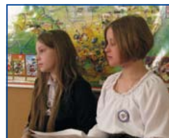
Każdy uczeń starał się przeczytać fragment tekstu najlepiej jak potrafił