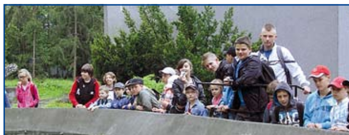
Warszawskie zoo jest idealnym miejscem na spędzenie wolnego czasu, można tam poznać tajemnice przyrody i natury zwierząt

Wyjazd do Warszawy odbył się w ramach realizacji zadania publicznego w zakresie kultury fizycznej i sportu powierzonych do realizacji w 2013 r. Stowarzyszeniu Inicjatyw Lokalnych Gminy Niemce przez Wójta Gminy Niemce. (awu)