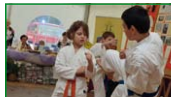
Publiczność mogła obejrzeć także pokaz taekwondo w wykonaniu uczniów szkoły i przedszkola w Nasutowie