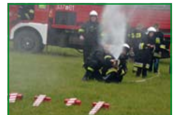
Pokaz strażacki wzbudził wiele emocji