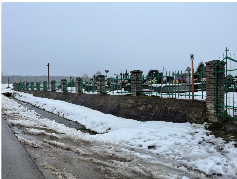
Fot.1 Widok ogrodzenia frontowego