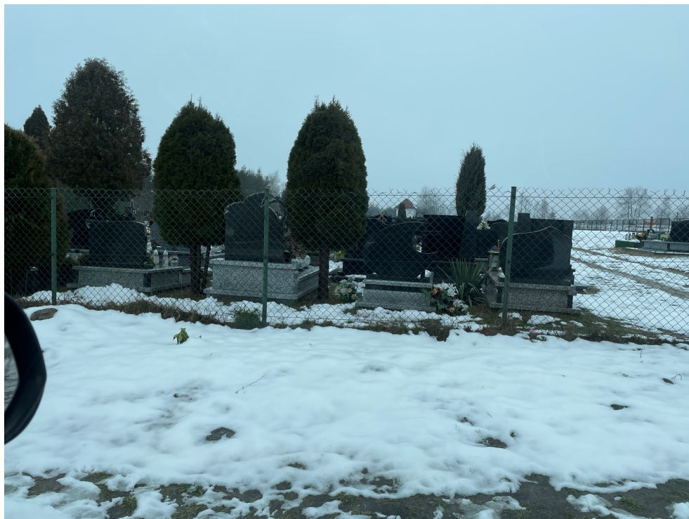
Fot.5 Ogrodzenie boczne z siatki ogrodzeniowej na linkach stalowych