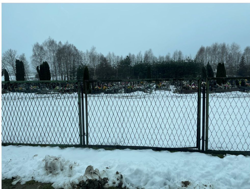
Fot.4 Ogrodzenie boczne z siatki cięto-ciagnionej