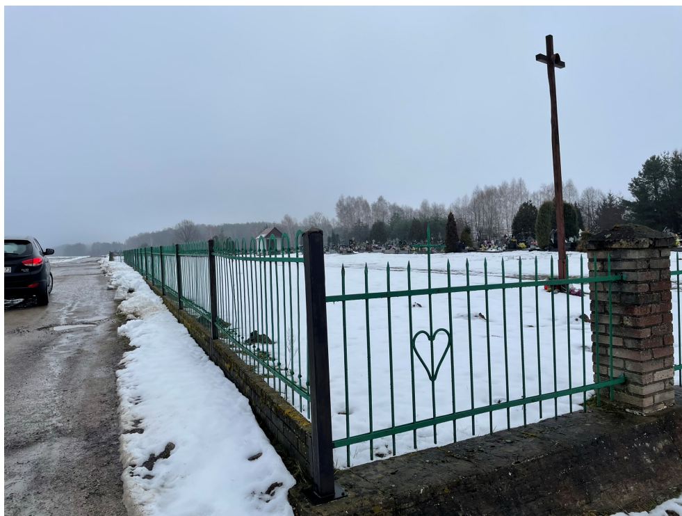
Fot.3 Ogrodzenie boczne - kute