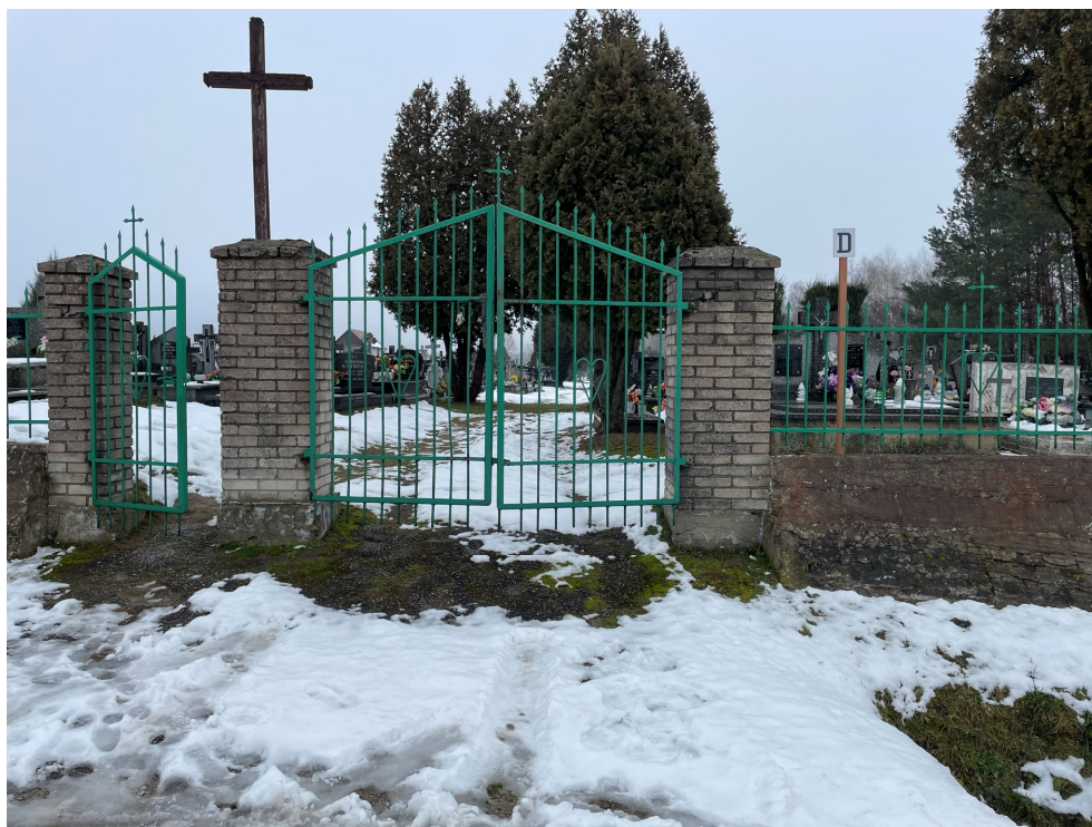
Fot.2 Widok bramy i furki w ogrodzeniu frontowym