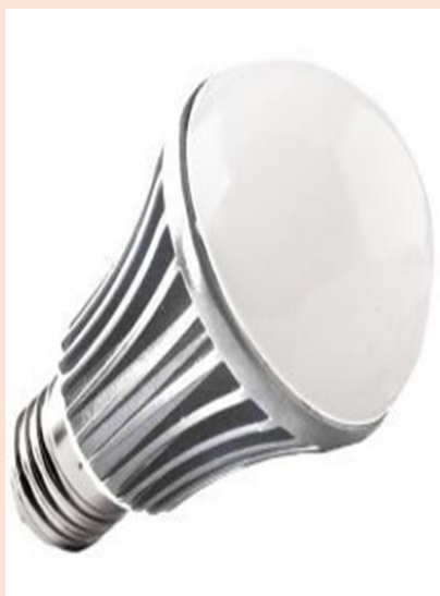
Pobór prądu: 11 W