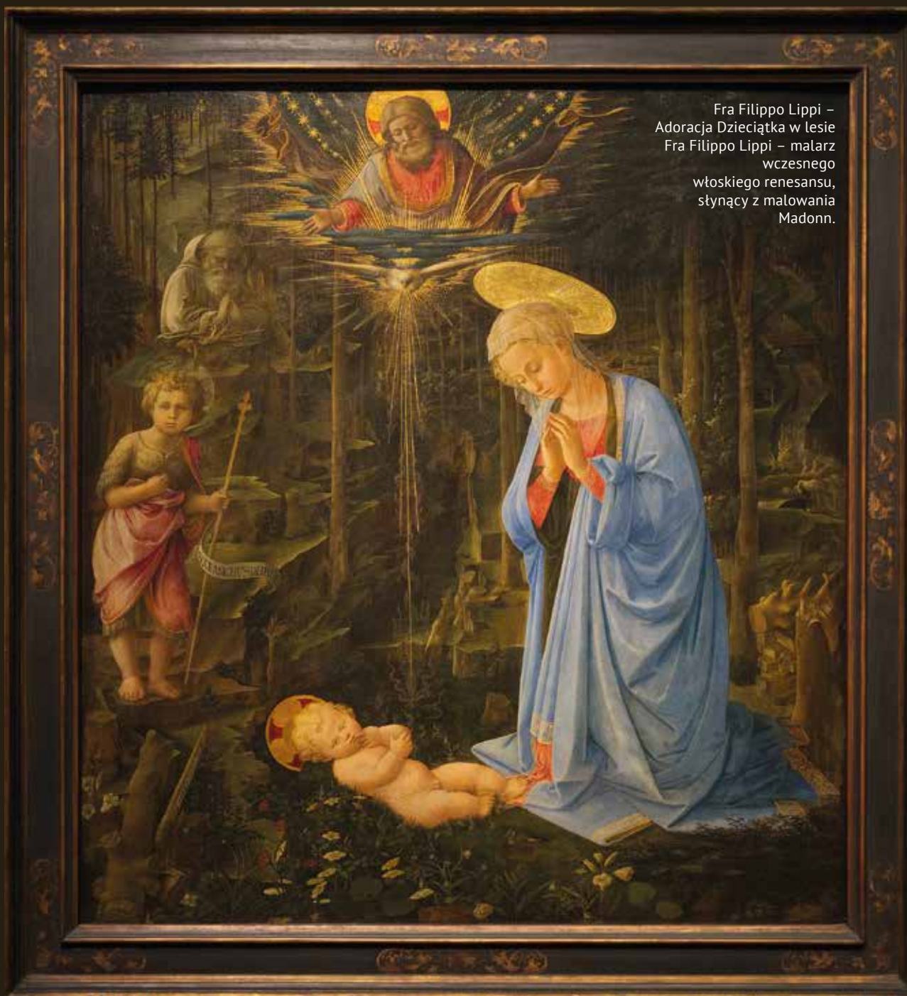
Fra Filippo Lippi – Adoracja Dzieciątka w lesie Fra Filippo Lippi – malarz wczesnego włoskiego renesansu, słynący z malowania Madonn.