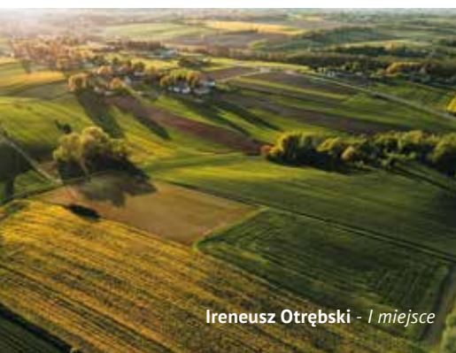
Ireneusz Otrębski - I miejsce

Gratulujemy zwycięzcom i życzymy dalszych sukcesów!