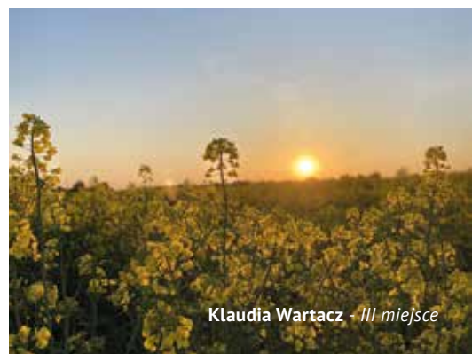
Klaudia Wartacz - III miejsce