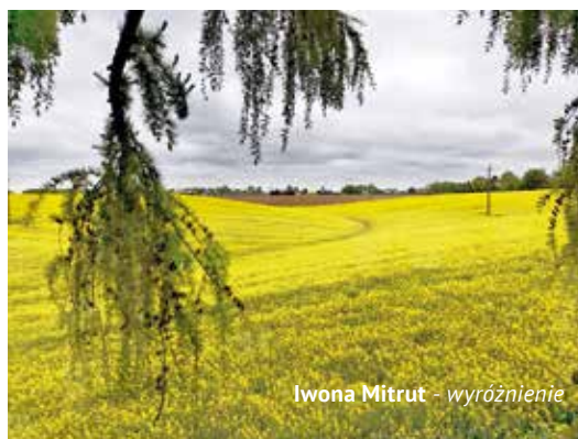
Iwona Mitrut - wyróżnienie