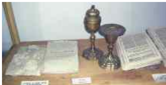
Eksponaty w Muzeum Regionalnym w Wąwolnicy

Wąwolnica , ul. Zamkowa 24 (podziemia kaplicy MB Kębelskiej), tel. 81 882 50 04