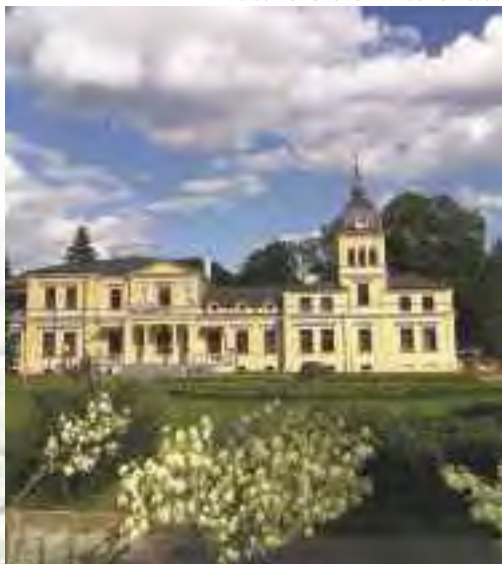
Pałac Kleniewskich w Kluczkowicach