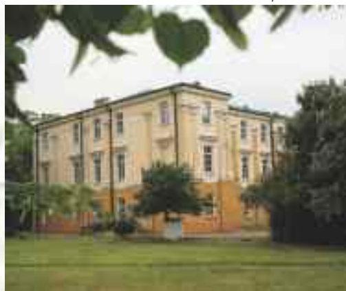
Pałac Lubomirskich w Opolu Lubelskim

Pałac w Józefowie nad Wisłą – to dawna rezydencja Potockich. Na początku XX w. pałac spłonął. Został odbudowany w okresie międzywojennym. W zachodniej części pałacu znajduje się taras widokowy, skąd można podziwiać malowniczy fragment doliny Wisły. Pałac otacza niewielki park z rzeźbioną ławką z podobizną Chrystusa. Obecnie w budynku mieści się Urząd Gminy.