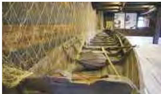
Ekspozycja muzealna w spichlerzu z Podlodowa

Zamek w Janowcu – w trzech salach na parterze zgromadzono eksponaty poświęcone przeszłości zamku, jego właścicielom, historii konserwacji obiektu. Na ekspozycję muzealną składa się także spichlerz z Podlodowa z wystawą etnograficzną oraz dwór z Moniak prezentujący zrekonstruowane wnętrza domu ziemianńskiego z przełomu XIX i XX wieku.