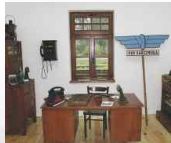
Pomieszczenie naczelnika stacji w Izbie Pamięci Kolejnictwa

Izba Pamięci Kolejnictwa mieści się w Karczmiskach przy głównej stacji Nadwiślańskiej Kolejki Wąskotorowej. W trzech pomieszczeniach zorganizowano stałą ekspozycję poświęconą historii tu-tejszej kolejki. Możemy tu zobaczyć m.in. fragmenty szyn o rozstawie 75 cm, urządzenia kolejowe, sztandary i mundury kolejowe, wystrój dawnego pomieszczenia naczelnika stacji, szafy biletowe, centralkę telefoniczną, dokumenty dawnych pracowników i wystawę fotograficzną pokazującą historię tego miejsca.