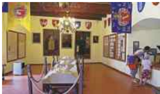
Salę muzealne na zamku w Janowcu

Janowiec , ul. Lubelska 20, tel. 81 881 52 28, zamekjanowiec@mnkd.pl