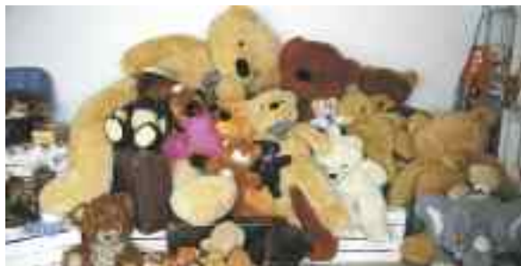
Muzeum Misiów i Torebek w Nałęczowie