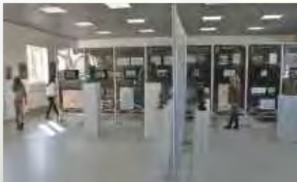
Muzeum Multimedialne w Opolu Lubelskim