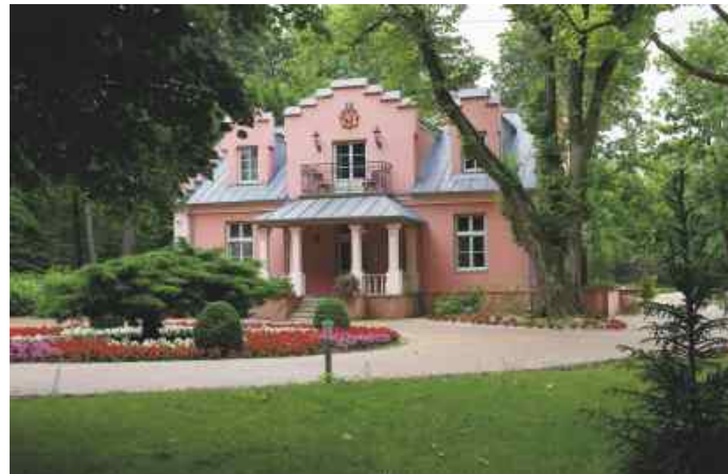
Willa Nagórskich - Różana