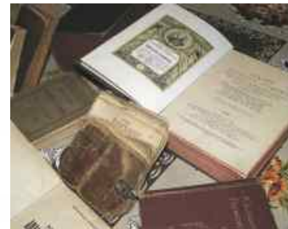
Izba Pamięci Aptekarskiej w Ponia- towej

Poniatowa , ul. Młodzieżowa 1 (apteka Galenica), tel. 81 820 37 09