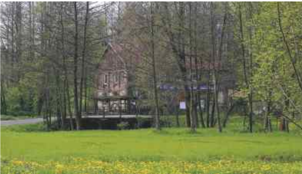
Młyn wodny na Bystrej w Nowym Gaju

Przez setki lat charakterystycznym elementem krajobrazu Krainy Lessowych Wąwozów były koła poruszające młyny wodne . Miejscowa ludność wykorzystywała potencjał energetyczny rzek; koła wodne poruszały także tartaki i papiernie. Liczne młyny świadczą o tym, że żyzne ziemie sprzyjały rozwojowi produkcji rolniczej i przemiatu zbóż na mąkę. Do dziś zachowały się młyny na rzekach Bystrej i Chodelce.