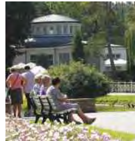
Pijalnia Wód nad stawem w Parku Zdrojowym

Park Zdrojowy w Nałęczowie z Pałacem Małachowskich oraz obiektami uzdrowiska, to miejsce które już w XIX w. kojarzyło się z odpoczynkiem zalecanym przez lekarzy. Słynna miejscowość kuracyjna związana jest z rodem Małachowskich i ich działalnością. Najokazalszym obiektem w parku jest Pałac Małachowskich wzniesiony w stylu barokowym według projektu architekta królewskiego Ferdynanda Naxa.