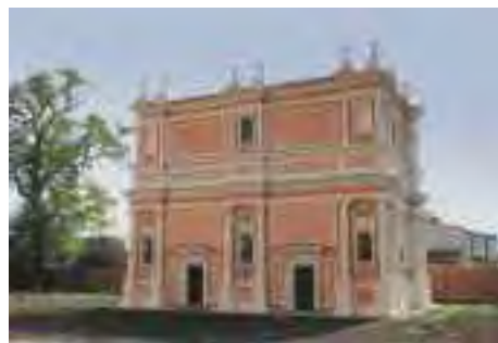
Domek Loretański w Golebiewo

Kościół św. Katarzyny i św. Floriana w Golebiewo – wg. źródeł, król Kazimierz Sprawiedliwy wznosił w latach 1170–1173 dwa kościoły drewniane: jeden pw. św. Katarzyny Aleksandryjskiej i drugi pw. św. Floriana. W 1419 r. obie parafie połączono. W l. 1626–1638 wybudowano obecny kościół w stylu renesansowo-manierystycznym. Znajdujący się nieopodal Domek Loretański jest pierwszą tego typu budowlą na ziemiach polskich. Został zbudowany ok. 1634 r. na wzór „Świętego Domu” Maryi z Nazaretu, przeniesionego w XIII w. do włoskiego miasta Loreto.