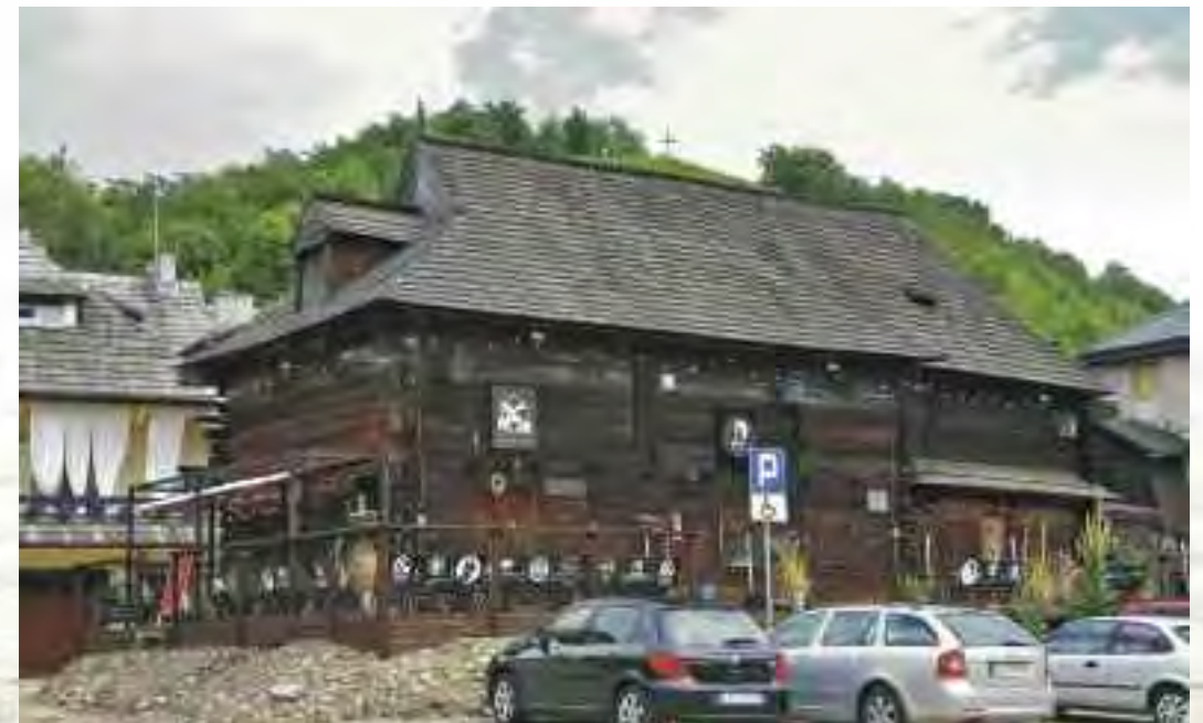
Dawne jatki żydowskie w Kazimierzu Dolnym

O czasach, kiedy Żydzi stanowili znaczny odsetek polskiego społeczeństwa przypominają kirkuty w Kazimierzu Dolnym, Wąwolnicy, Opolu Lubelskim. Na kazimierskim kirkucie ostatni pogrzeb odbył się w 1942 r.