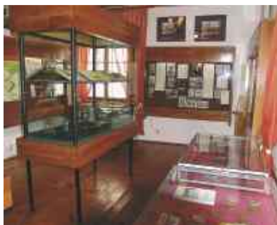
Muzeum Oświatowe w Puławach

Gołęb , ul. Puławska 1, tel. 601 814 527, muzeumrowerow@gmail.com