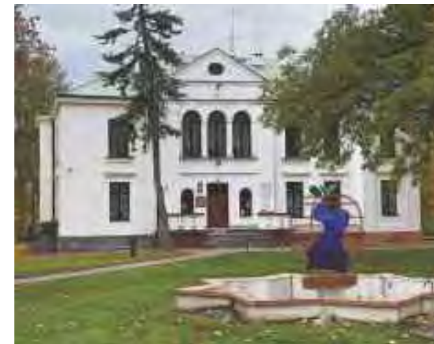
Pałac Potockich w Józefowie nad Wisłą