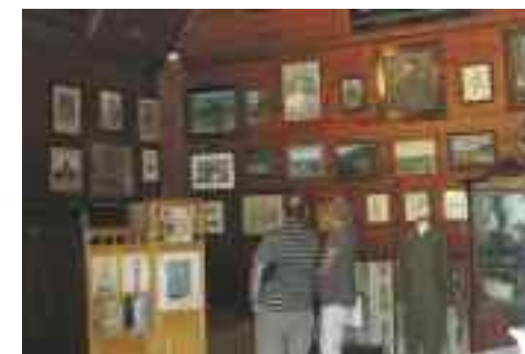
Wnętrze Muzeum Stefana Żeromskiego

Nałęczów , ul. S. Żeromskiego 8, tel. 81 501 47 80, 887 750 014, zeromski@muzeumlubelskie.pl