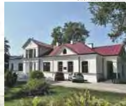
Dwór Kossaków w Kośminie