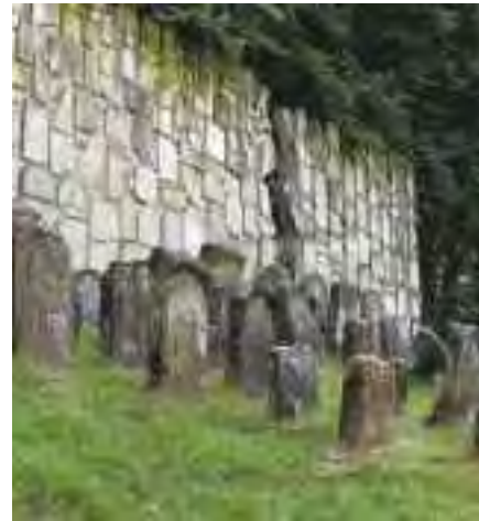
Cmentarz żydowski na Czerniawach

Przez setki lat charakterystycznym elementem krajobrazu Krainy Lessowych Wąwozów były koła poruszające młyny wodne . Miejscowa ludność wykorzystywała potencjał energetyczny rzek; koła wodne poruszały także tartaki i papiernie. Liczne młyny świadczą o tym, że żyzne ziemie sprzyjały rozwojowi produkcji rolniczej i przemiatu zbóż na mąkę. Do dziś zachowały się młyny na rzekach Bystrej i Chodelce.