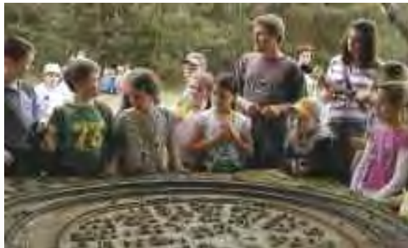
Makieta grodziska w Chodliku

Opole Lubelskie , ul. Strażacka 1, tel. 81 475 50 10, muzeum@opolelubelskie.pl