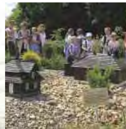
Park Miniatur Architektury Drewnianej w Rąbłowie

▶ Rąbłów, 24-160 Wąwolnica tel. 605 951 355, park-labiryntow@sobczuk.pl