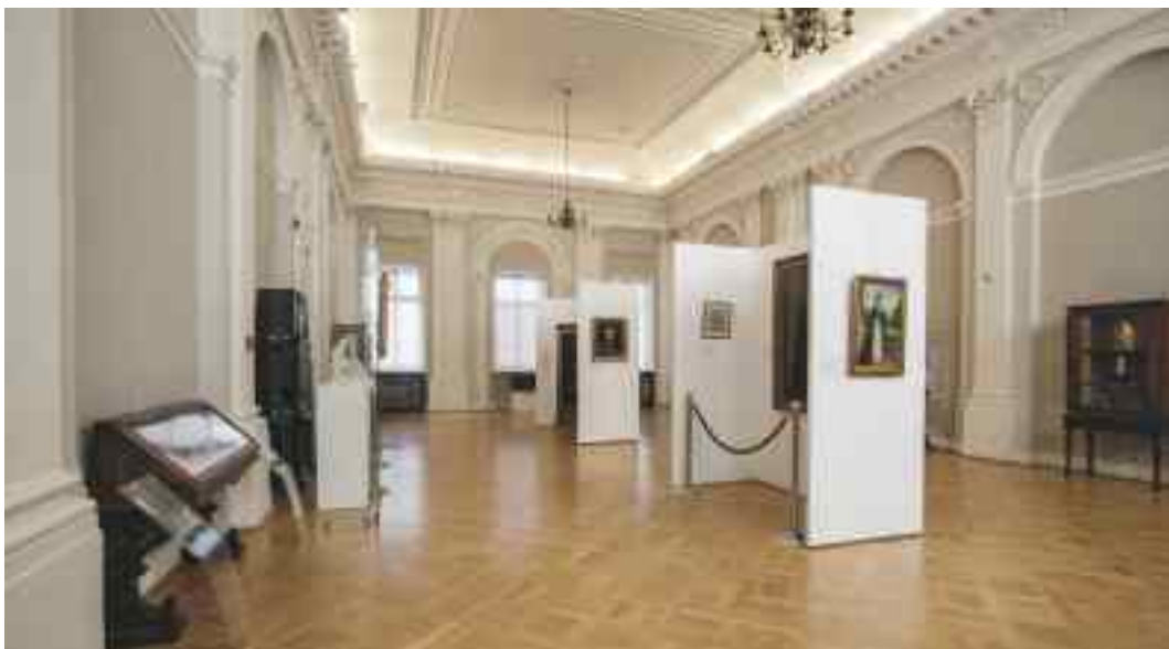
Muzeum Czartoryskich w Puławach

Muzeum Czartoryskich w Puławach – nawiązuje do idei pierwszego polskiego muzeum, założonego tutaj przez księżną Izabelę z Flemingów Czartoryską. Godne polecenia są zabijki i pamiątki z kolekcji księżnej.