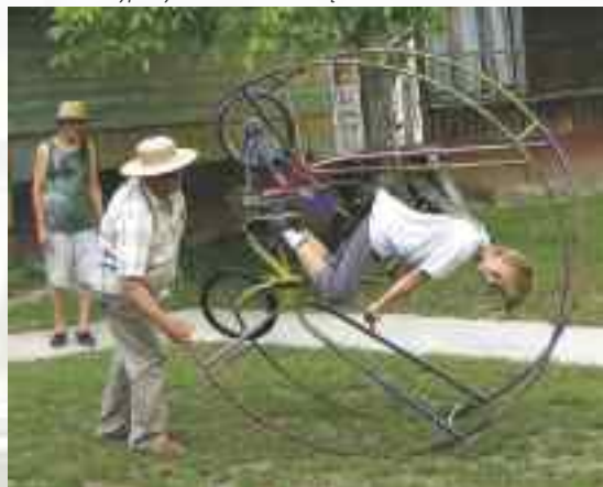
Muzeum Nietypowych Rowerów w Gołębju