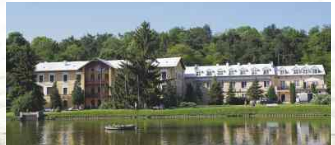
Sanatorium Książę Józef