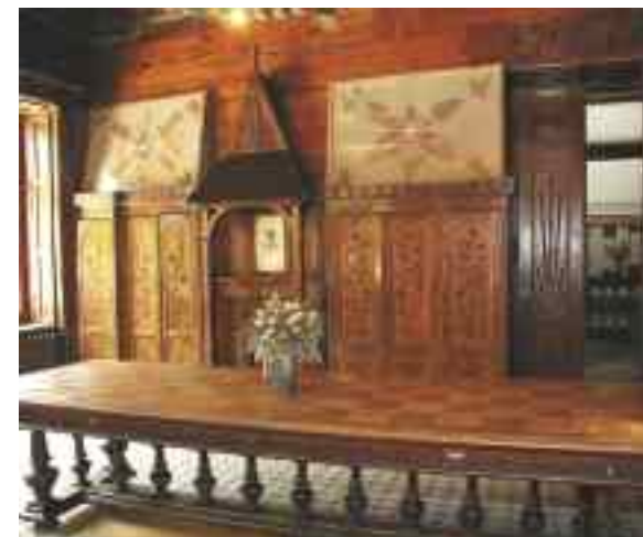
Biblioteka w stylu zakopiańskim w pałacu w Kluczkowicach

Muzeum Regionalne w Kluczkowicach – jego największą atrakcją jest biblioteka w stylu zakopiańskim projektu Stanisława Witkiewicza. Warty odwiedzin jest także dział historii kolejki wąskotorowej oraz dział prehistoryczny, gdzie można obejrzeć ekspozycję zabytków archeologicznych pochodzących z badań wykopaliskowych w grodziskach nad Chodelką – Chodliki i Żmijowiskach, Podgórzu i Kłodnicy.