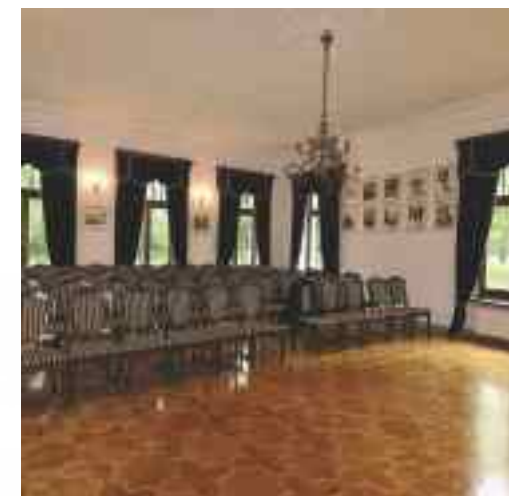
Wnętrze pałacu Gerliczów w Kraczewicach

Dwór w Kośminie – wiele osób uważa, że w zabytkowym dworze urodziła się Zofia Kossak. W rzeczywistości budowę dworu rozpoczęto w 1907 r., gdy pisarka miała już kilkanaście lat. Według źródeł historycznych, Zofia Kossak urodziła się w dworku postawionym lub kupionym przez rodziców, ale stał on na miejscu wcześniejszych zabudowań gospodarczych. Śladu po nim jednak nie ma. Wprawdzie Zofia Kossak była zawsze kojarzona z Kośminem, to jednak władze komunistyczne nie kwapiły się, aby to miejsce w jakikolwiek sposób upamiętnić chociażby symboliczną tablicą pamiątkową. Udało się to dopiero 15 maja 1990 r. Tego dnia szkole (mieściła się w dworku) nadano imię Zofii Kossak i ufundowano sztandar szkoły. Od 2014 roku swoją siedzibę w zabytkowym dworku ma Lokalna Grupa Działania „Zielony Pierścień”.