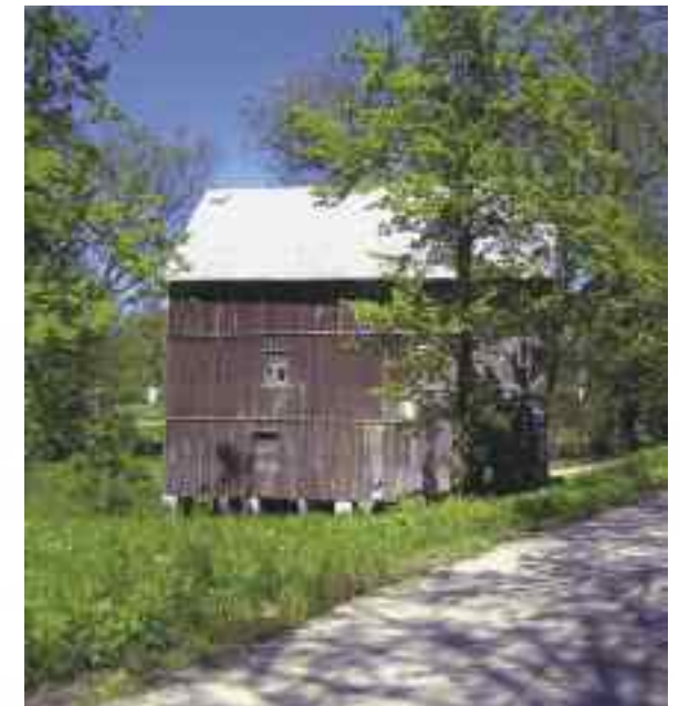
Młyn wodny w Iłkach-Celejowie

Młyn w Iłkach-Celejowie – jest to jedyne miejsce spiętrzenia wody na rzece Bystra (przez pięćset lat na rzece i jej dopływach istniały 23 urządzenia piętrzące). Młyn funkcjonuje do dzisiaj. Został tu przeniesiony z Witoszyna ok. 1900 r. Do napędu wykorzystywane były spiętrzone wody rzeki Bystrej. Od 1960 r. młyn napędzany jest elektrycznie. Betonowy jaz został zbudowany ok. 1957 r. dla potrzeb funkcjonujących poniżej stawów rybnych.