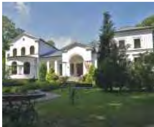
Pałac w Kęble

Pałac w Kluczkowicach – wiejska rezydencja ziemiańska z XIX w. wzniesiona dla rodziny Kleniewskich. W aranżację wnętrza zaangażowani byli m.in. Stanisław Witkiewicz i Wojciech Gerson. W 1942 r. w pałacu przebywali żołnierze frontowi Wehrmachtu na rekonwalescencji. Po nich przybył do Kluczkowic oddział ukraiński z żandarmerią niemiecką i stacjonowali tu do 1944 r. W pałacu warto zwrócić uwagę na bibliotekę zaprojektowaną w stylu zakopiańskim przez Stanisława Witkiewicza.