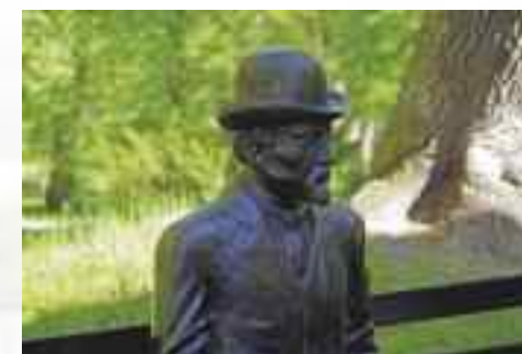
Pomnik Bolesława Prusa

Nałęczów , ul. S. A. Poniatowskiego 39, tel. 81 501 45 52, 887 750 013 prus@muzeumlubelskie.pl