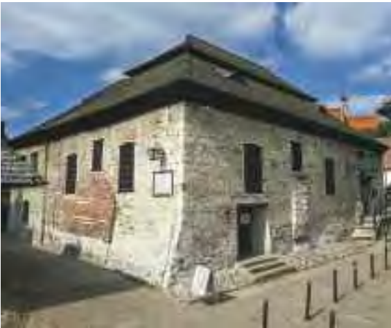
Dawna synagoga w Kazimierzu Dolnym