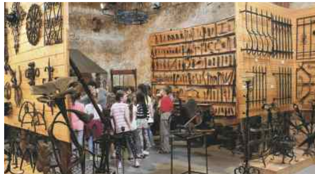
Muzeum Kowalstwa w Wojciechowie