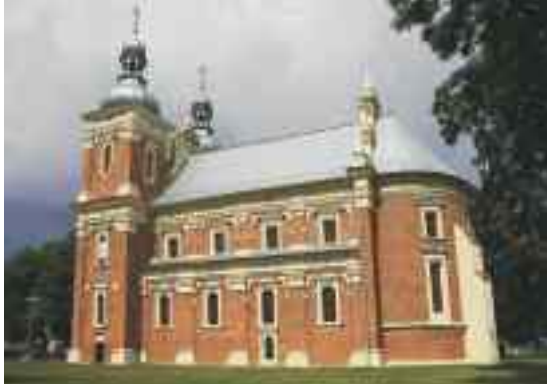
Kościół w Golebiewo