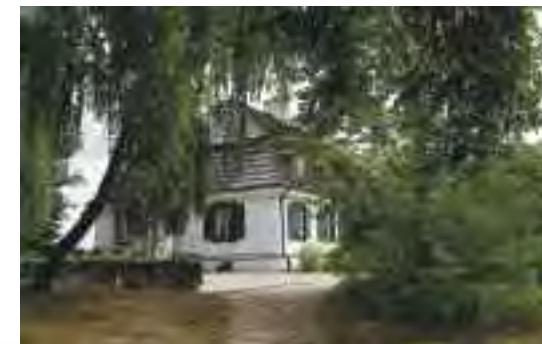
Dwór z Moniak

Wieża Ariańska w Wojciechowie – jedyna na Lubelszczyźnie tego typu gotycko-renesansowa budowla. Powstała w pierwszej połowie XVI w. Wieża pełniła dwie funkcje: mieszkalną i obronną. Obronności służyła także fosa, którą wykopano przy okazji budowy wcześniejszego dworu z II poł. XIV w. W latach 1550-98 swoją siedzibę miał tu zbor kalwiński. Obecnie mieści się tu Gminny Ośrodek Kultury z Muzeum Kowalstwa i Muzeum Regionalnym.