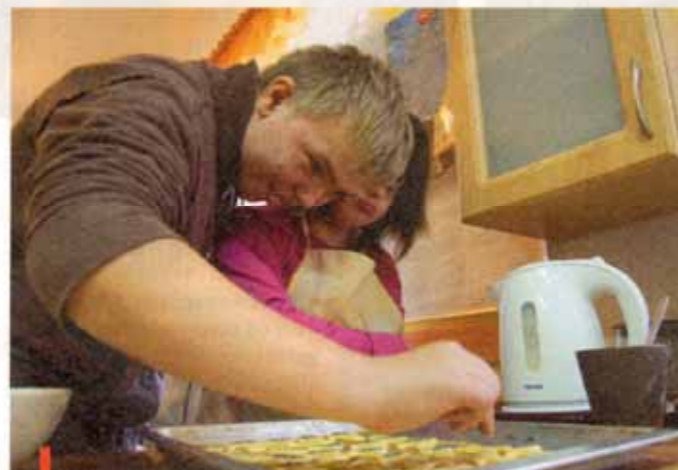
Korzyści płynących z przebywania z rówieśnikami nic nie jest w stanie zastąpić

Najczęściej dzieci z deficytami doświadczają nadopiekuńczości rodziców, którzy boją się pozwolić im na samodzielność. Nie wynika to ze złej woli, ale z obawy, by dziecko nie zrobiło sobie albo komuś krzywdy. – To często zamknięte koło. Na przykład rodzice karmią swoje dzieci, twierdząc, że same nie są w stanie się najęść, nie pozwalają na wykonywanie żadnych domowych obowiązków, jak choćby zmywanie naczyń, sprzątanie czy pomoc w kuchni. Kiedy dziecko trafia do nas, do szkoły, słyszymy, że trzeba je umyć, nakarmić, ubrać. Czasami rzeczywiście trzeba, ale w wielu przypadkach, kiedy pozwoli się im spróbować, okazuje się, że one to potrafią. Będąc w grupie, przyglądają się jeden drugiemu i naśladowują