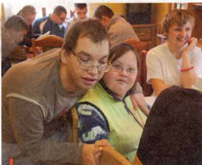
Każdy z uczniów jest wyjątkowy i niepowtarzalny