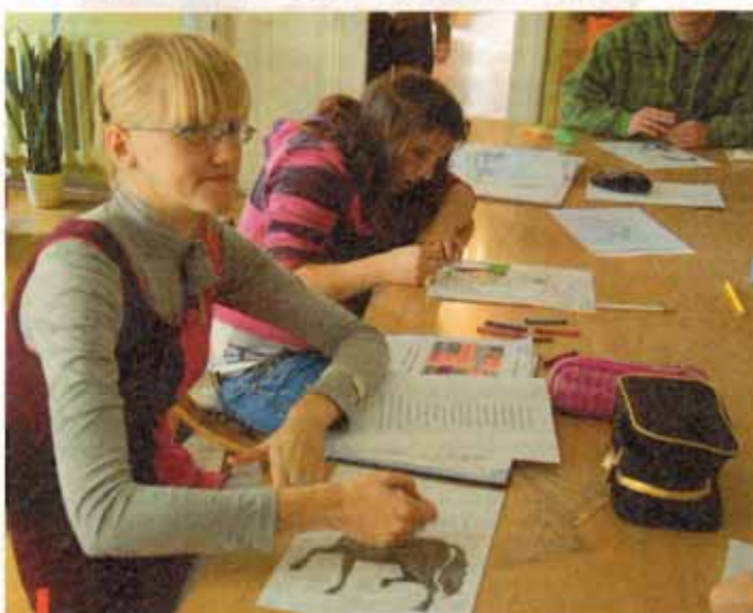
Nauka połączona z zabawą to najlepszy sposób na udane zajęcia