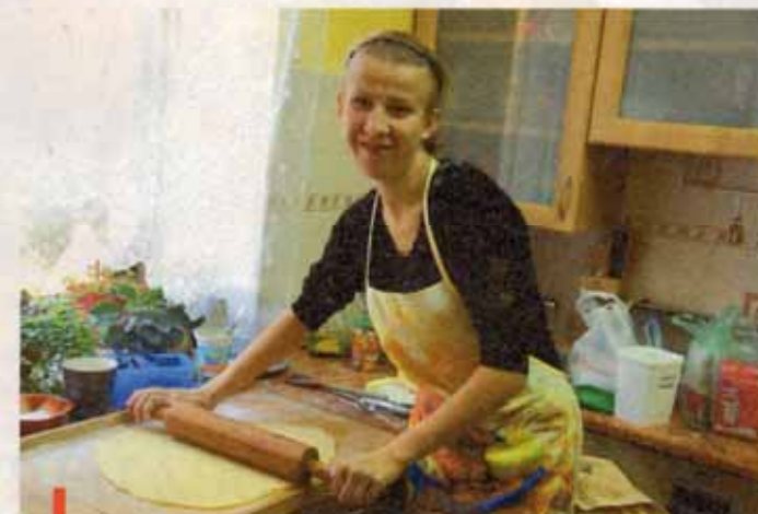
W pracowni gospodarstwa domowego uczniowie rozwijają talenty kulinarne

się. Jeśli ktoś widzi, że kolega obok bierze łyżkę i próbuje jeść zupę, to robi to samo – mówią nauczyciele. Rodzice często są w szoku, gdy zabierają dziecko na weekend do domu i zauważają, że samo zjadło albo założyło skarpetki, albo zaczęło zmywać naczynia. Dla rodziców każde takie odkrycie to radość, jakby ich pociecha wygrała jakiś konkurs, albo zdobyła medal na olimpiadzie.