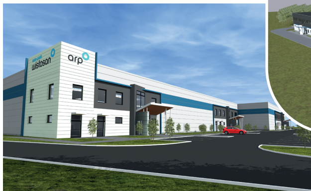
Hala w Radomiu

Przykładowe projekty inwestycyjne realizowane przez TSSE EURO-PARK WISŁOSAN