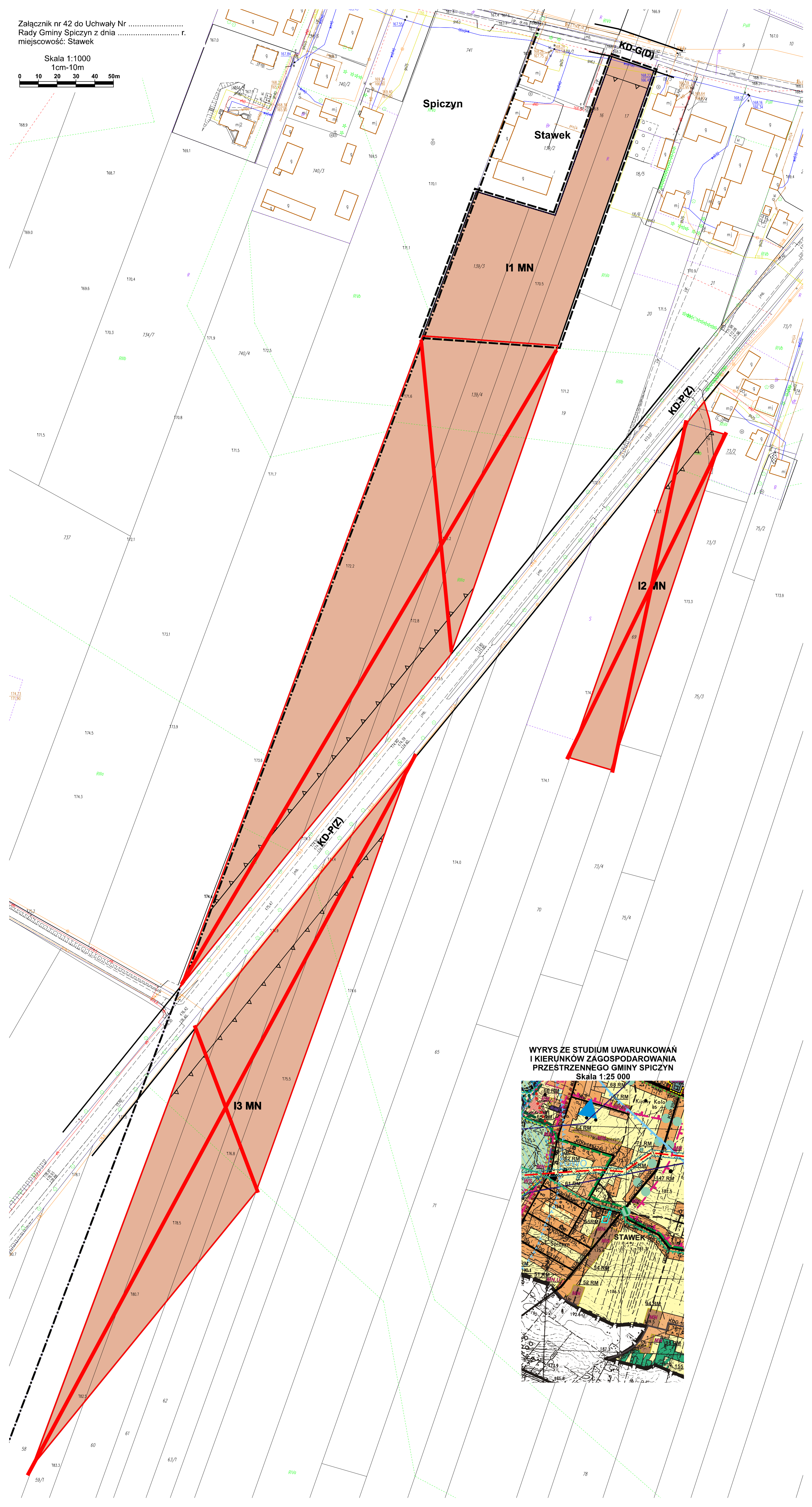
WYRYS ZE STUDIUM UWARUNKWAŃ I KIERUNKÓW ZAGOSPODAROWANIA PRZESTRZENNEGO GMINY SPICZYN Skala 1:25 000