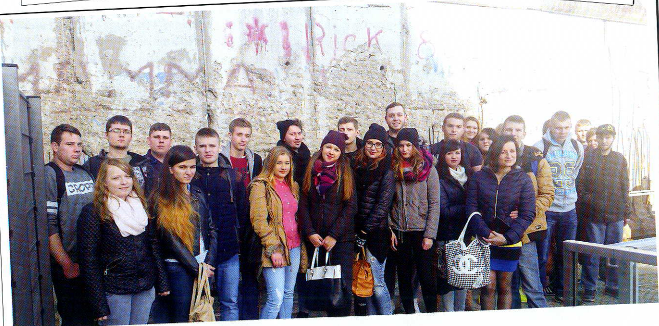
Wycieczka „Śladami muru berlińskiego”