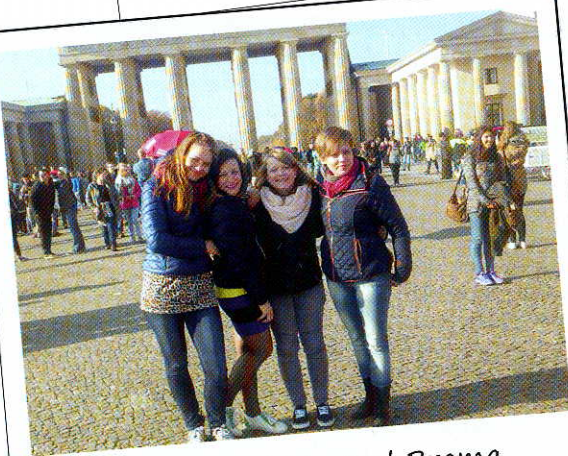
Uczestniczki projektu pod Bramą Brandenburską