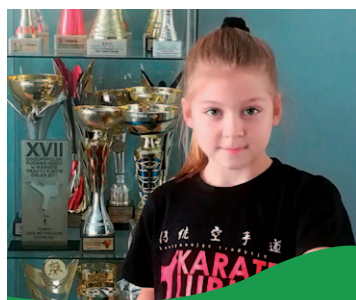
Wywiad z Moniką Ostrowską - Mistrzynią Świata w karate str. 24