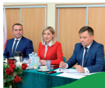
I inauguracyjna Sesja Rady Gminy str. 28