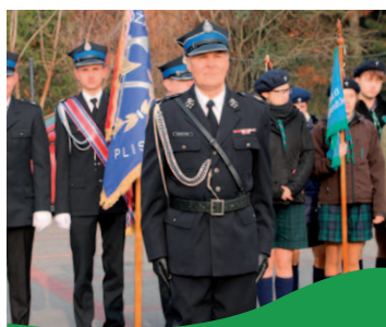
Święto Niepodległości w gminie Wólka str. 19