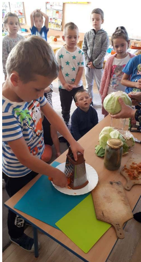
Fot. Przedszkole w Turce (6)

Przedszkolaki uczestniczyły w niecodziennym zajęciu przybliżającym tradycję kiszenia kapusty, a także podsumowywały swoją wiedzę na temat przetworów na zimę. Dzieci wraz z paniami zabrały się ochoczo do pracy: szatkowały kapustę, tarły marchewkę, przyprawiały kapustę w słoikach. Oczywiście każdą warstwę posypywały solą. W dokładnym ugnieceniu pomogły dzieciom panie. Dzieci dowiedziały się iż, kiszona kapusta, oprócz walorów smakowych, jest cennym źródłem wielu witamin.