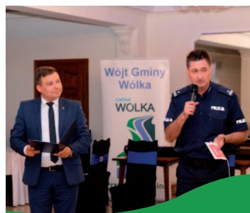
Gminny Dzień Seniora str. 23