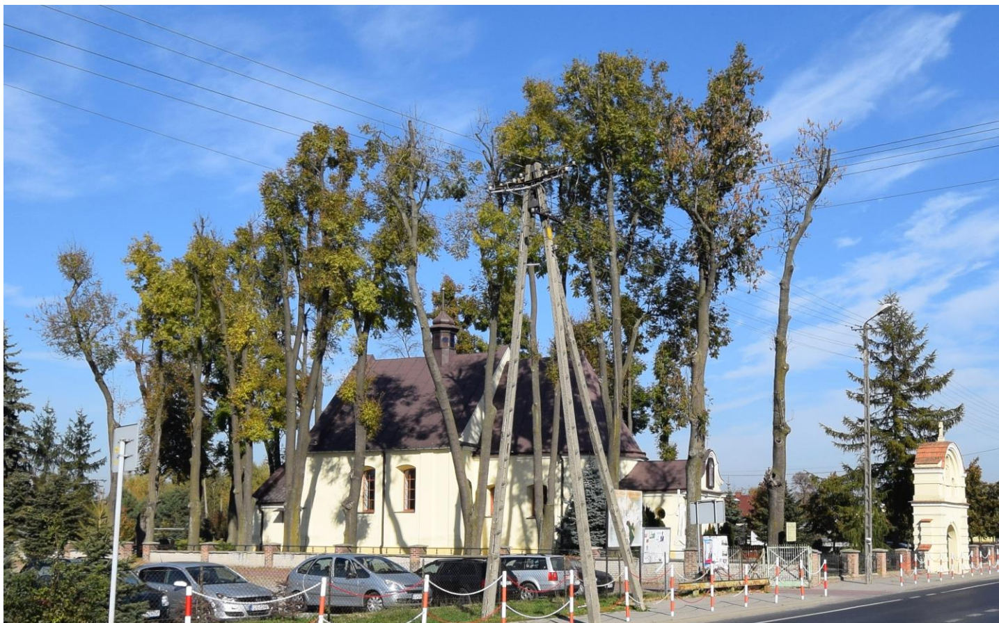
Widok od południa

8. Fotografia z opisem wskazującym orientację albo mapa z zaznaczonym stanowiskiem archeologicznym