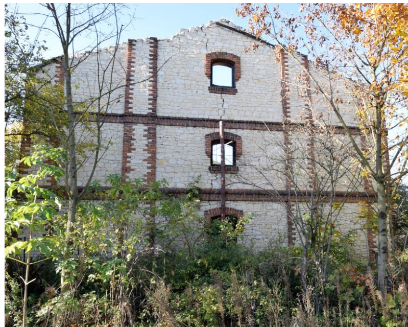
Widok od południowego wschodu