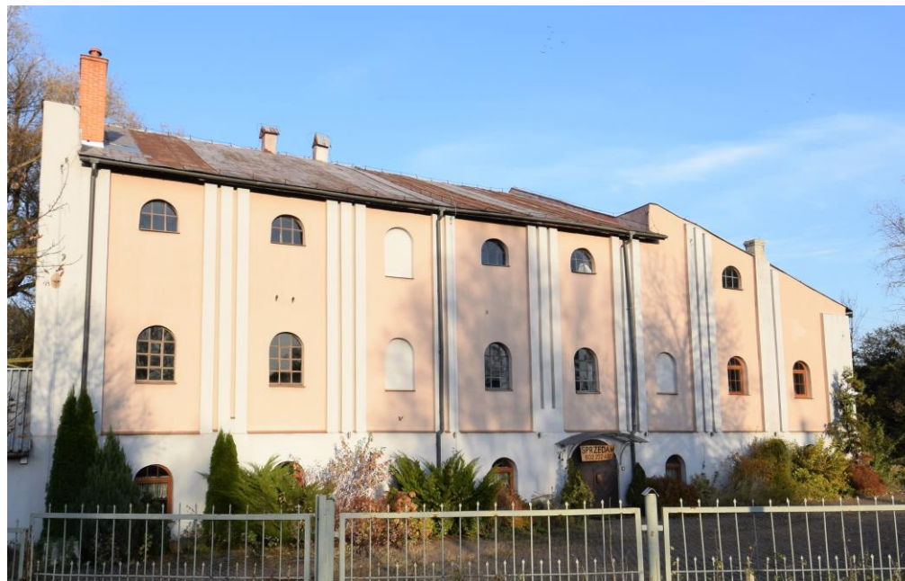
Widok od zachodu