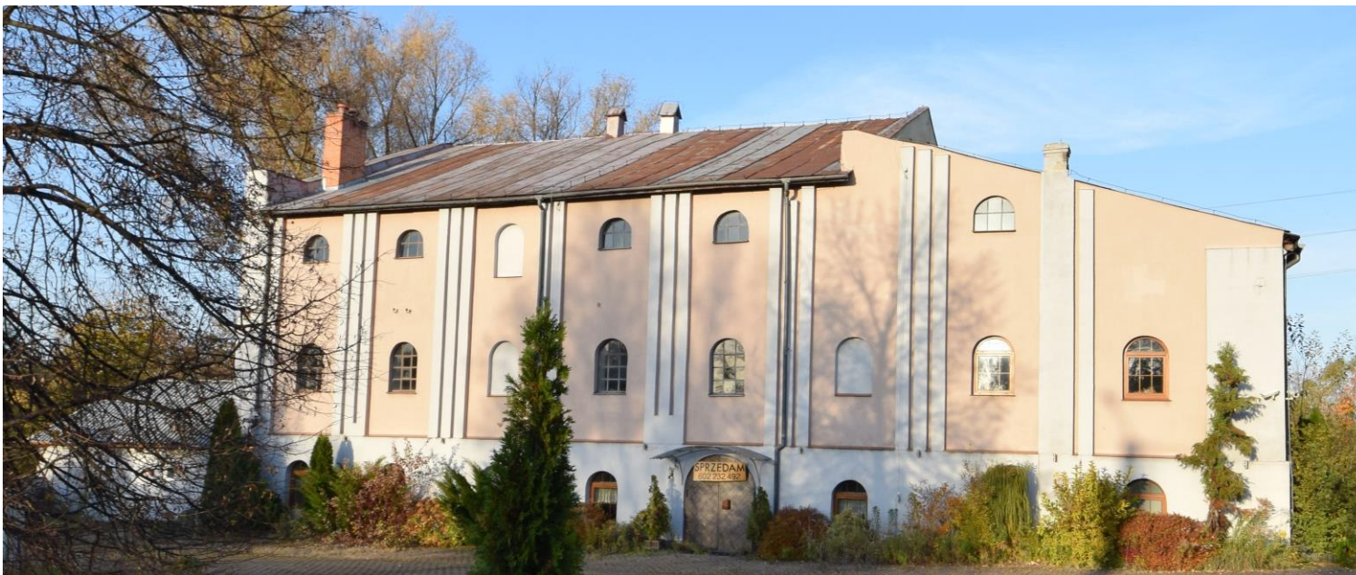
Widok od południowego zachodu

8. Fotografia z opisem wskazującym orientację albo mapa z zaznaczonym stanowiskiem archeologicznym