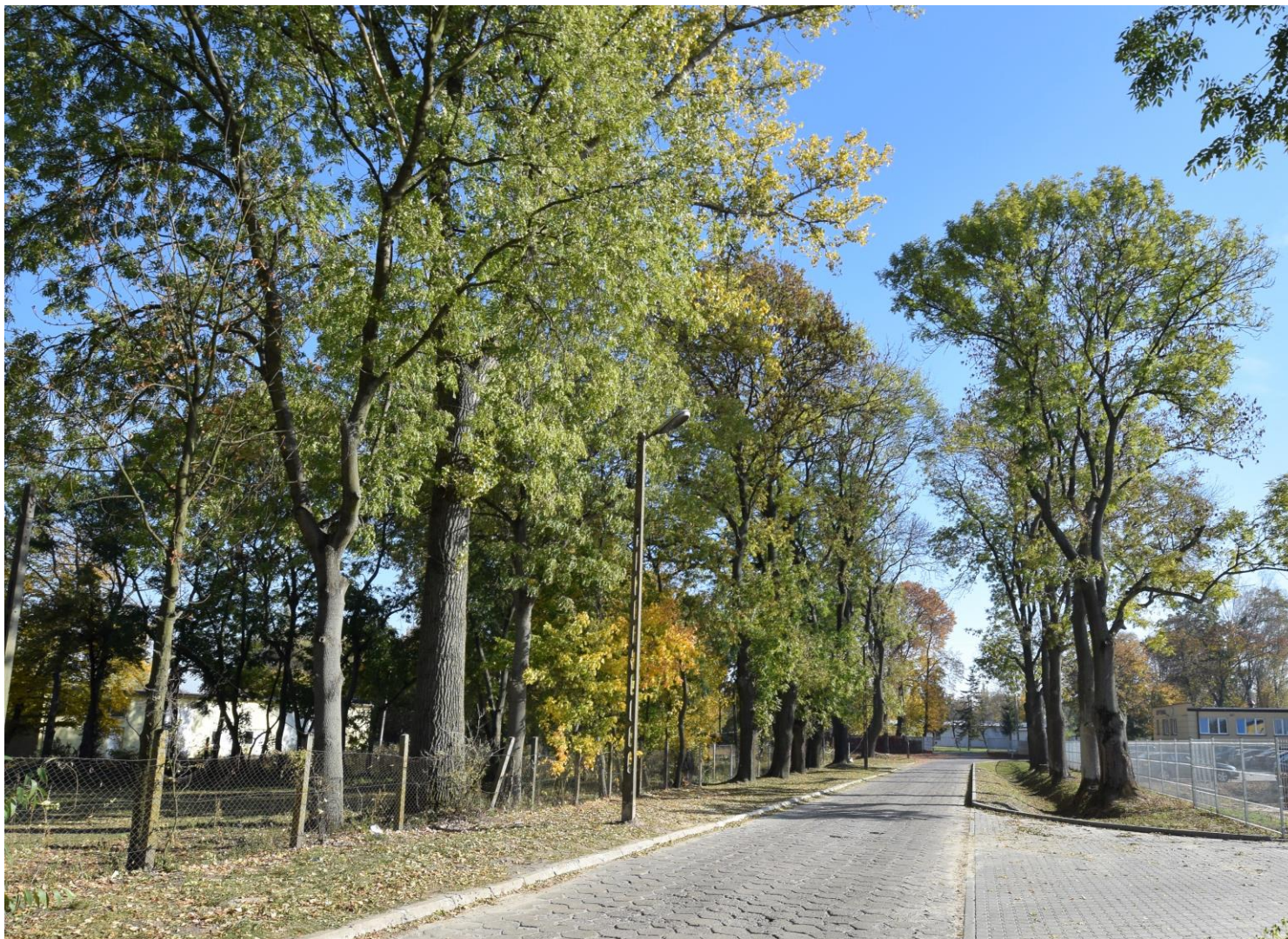
Widok od zachodu

8. Fotografia z opisem wskazującym orientację albo mapa z zaznaczonym stanowiskiem archeologicznym