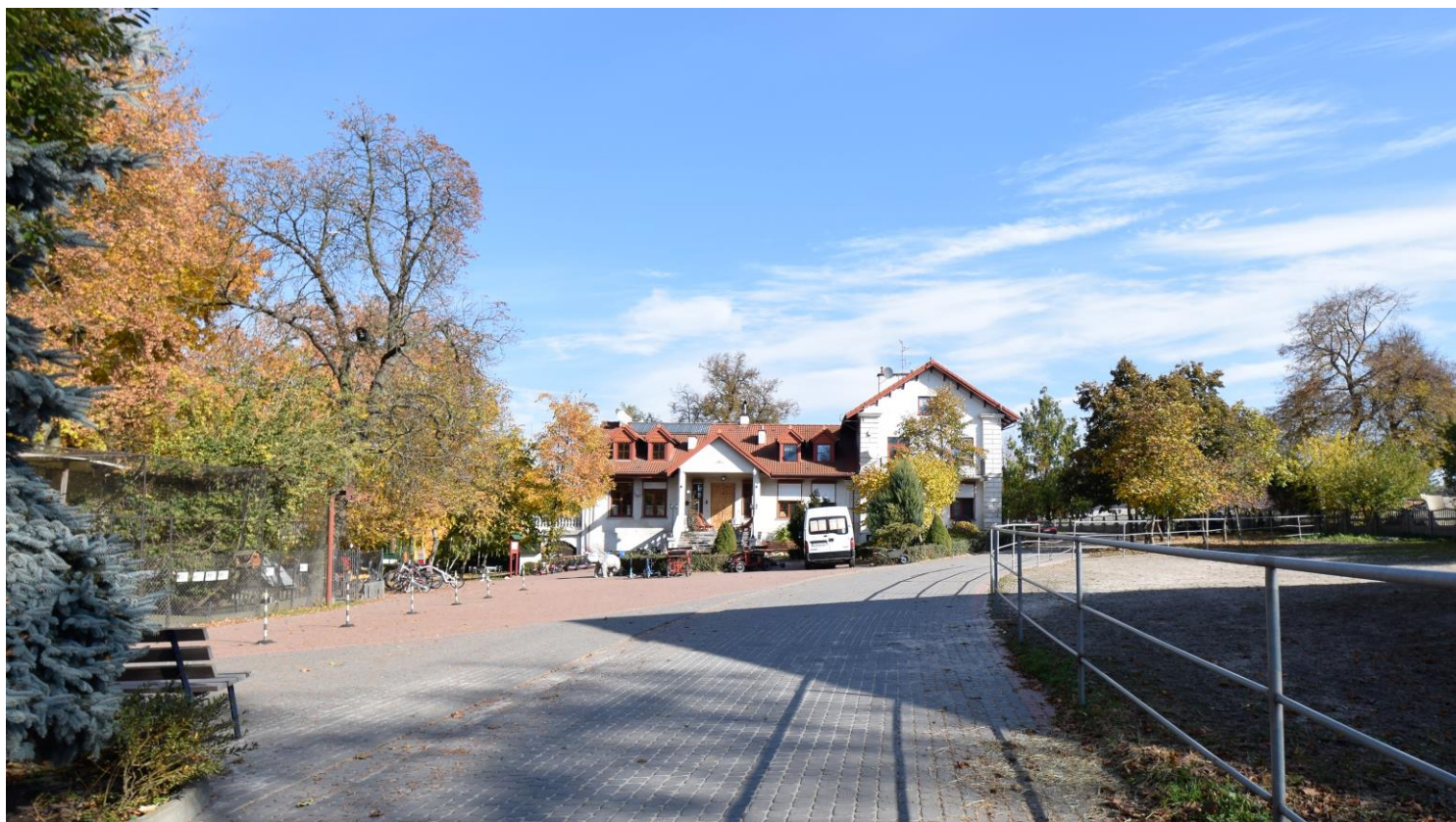
Widok od południowego zachodu

8. Fotografia z opisem wskazującym orientację albo mapa z zaznaczonym stanowiskiem archeologicznym