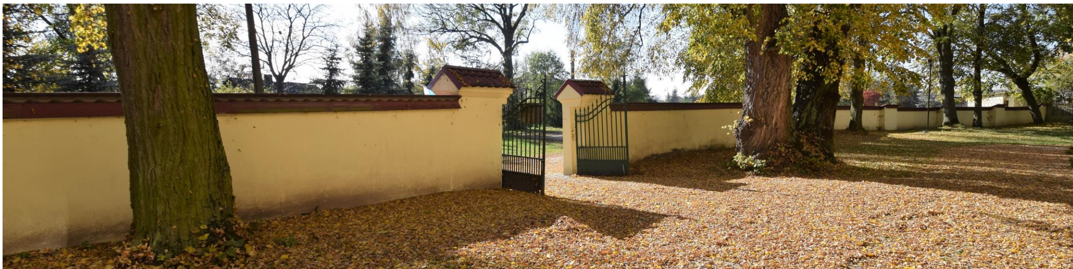
Widok od północnego wschodu