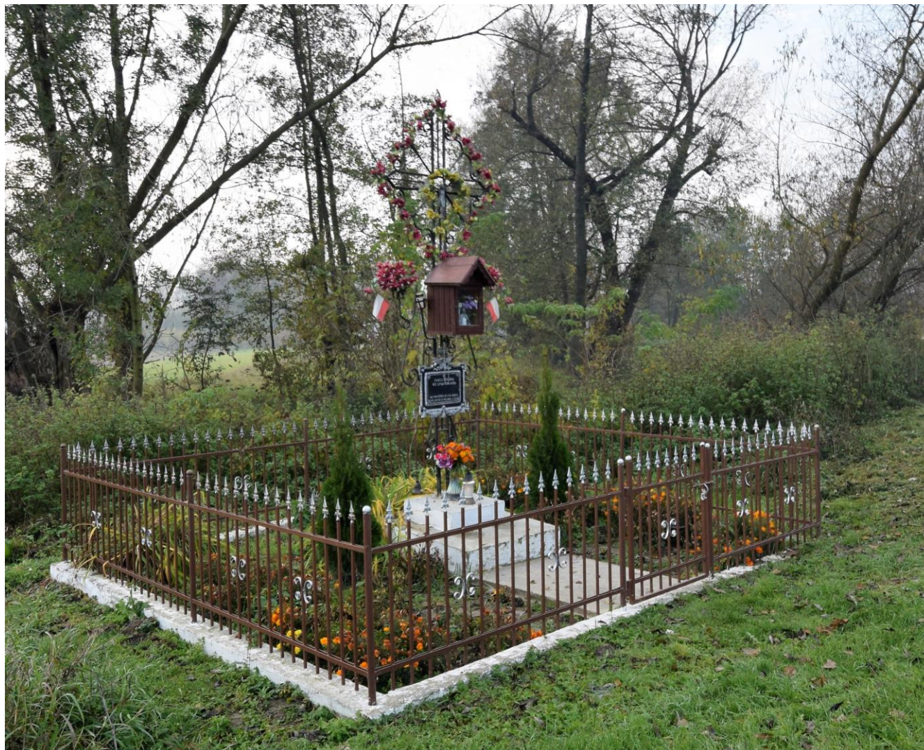
Widok od północnego wschodu

8. Fotografia z opisem wskazującym orientację albo mapa z zaznaczonym stanowiskiem archeologicznym