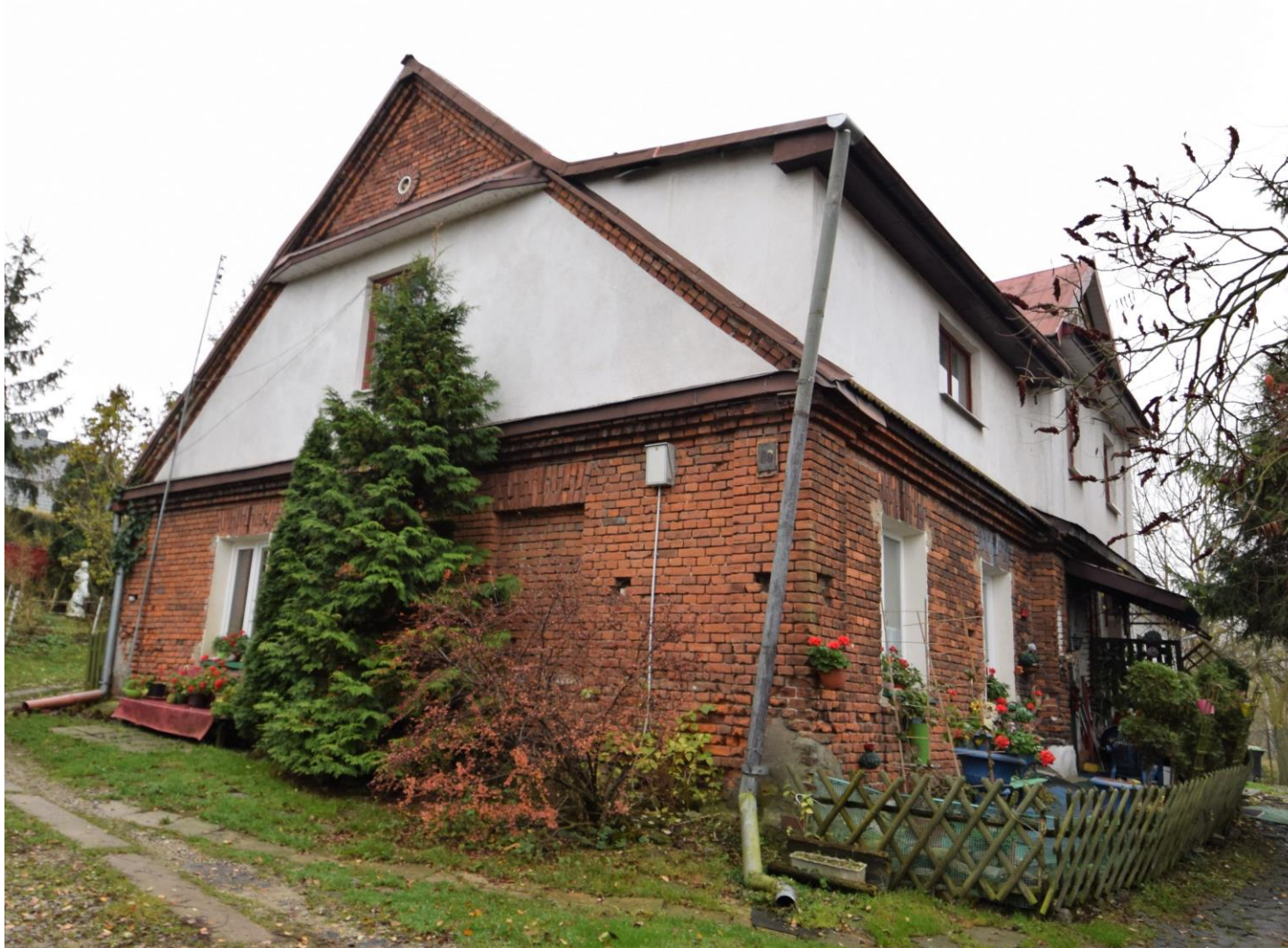
Widok od północnego wschodu

8. Fotografia z opisem wskazującym orientację albo mapa z zaznaczonym stanowiskiem archeologicznym