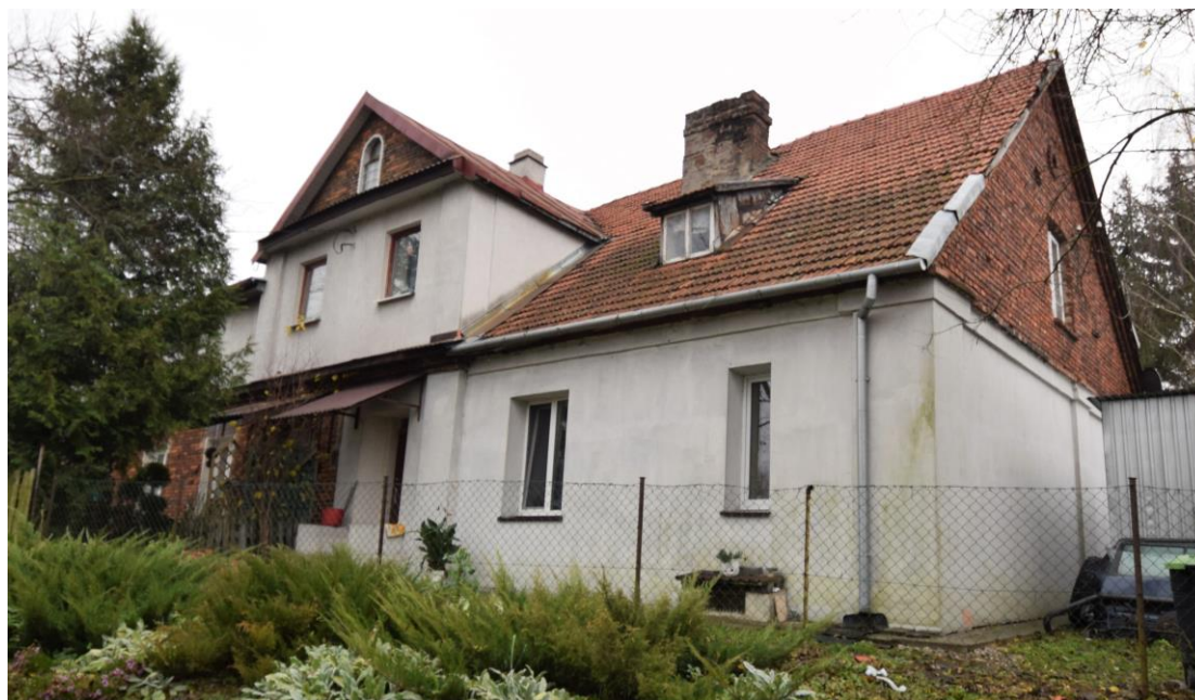
Widok od północnego zachodu