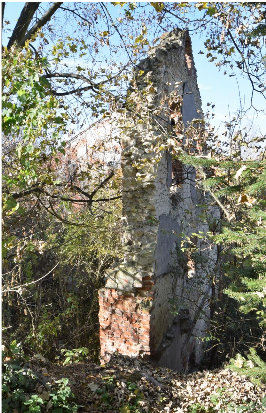
Widok od południa