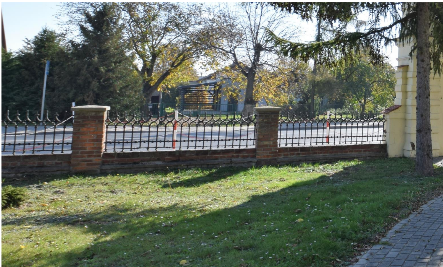
Widok od północnego zachodu

8. Fotografia z opisem wskazującym orientację albo mapa z zaznaczonym stanowiskiem archeologicznym