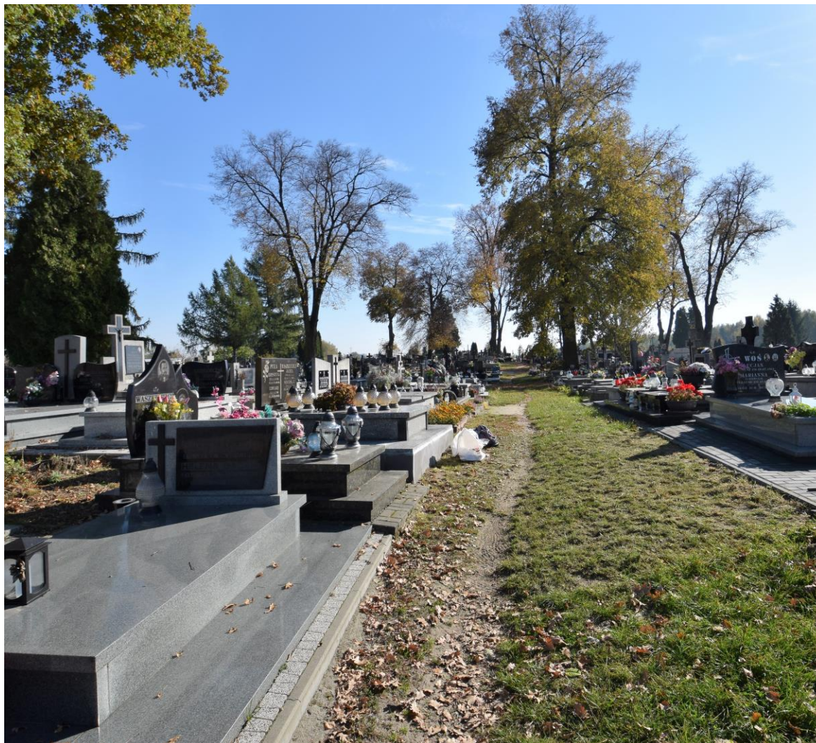
Widok od północnego zachodu

8. Fotografia z opisem wskazującym orientację albo mapa z zaznaczonym stanowiskiem archeologicznym