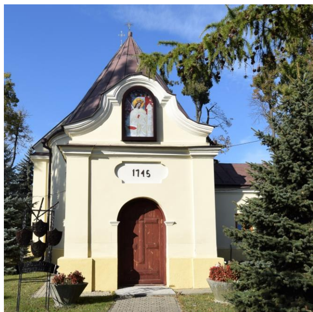
Widok od południowego wschodu