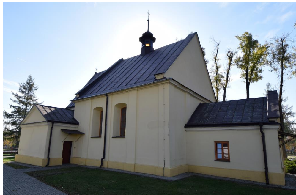
Widok od północy