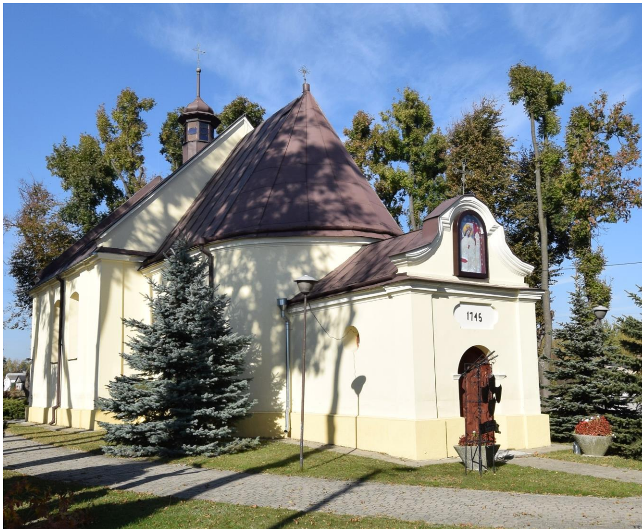
Widok od południa

8. Fotografia z opisem wskazującym orientację albo mapa z zaznaczonym stanowiskiem archeologicznym