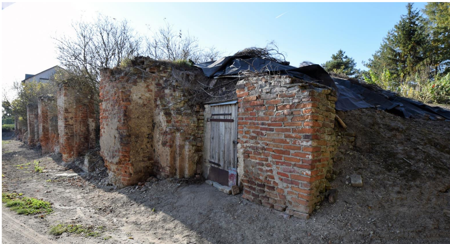
Widok od północnego wschodu

8. Fotografia z opisem wskazującym orientację albo mapa z zaznaczonym stanowiskiem archeologicznym