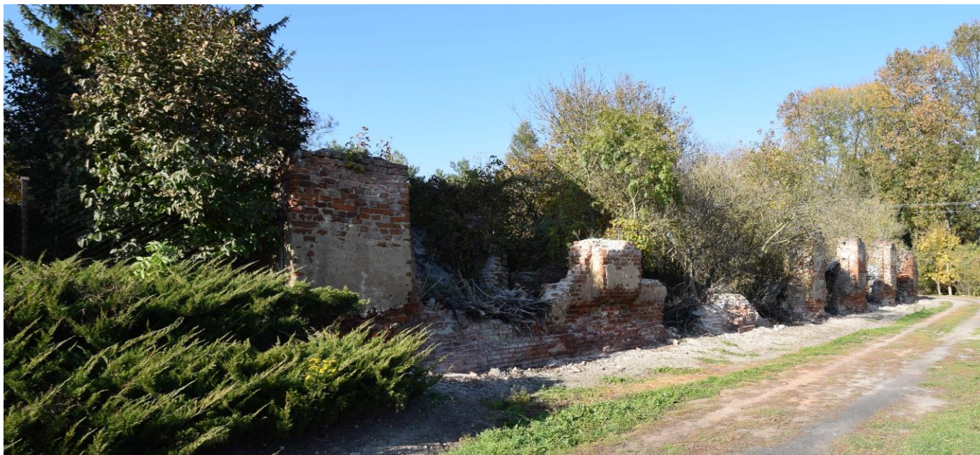
Widok od południowego wschodu