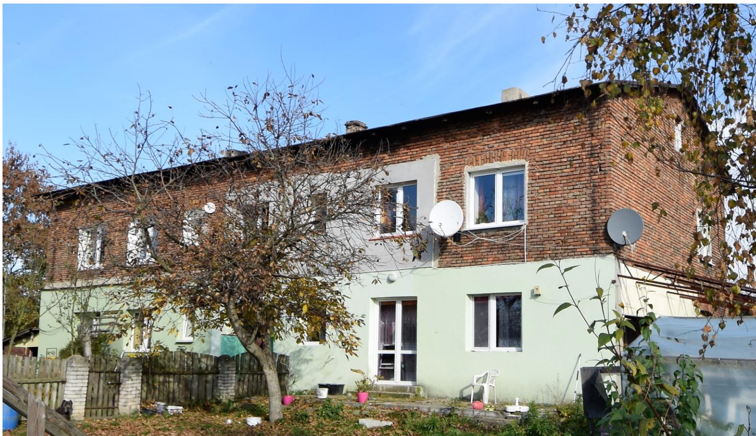
Widok od południa

8. Fotografia z opisem wskazującym orientację albo mapa z zaznaczonym stanowiskiem archeologicznym