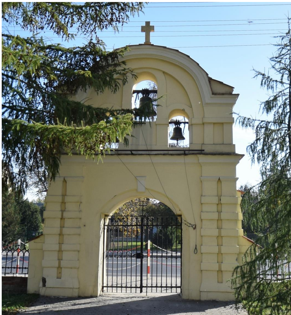
Widok od północnego zachodu