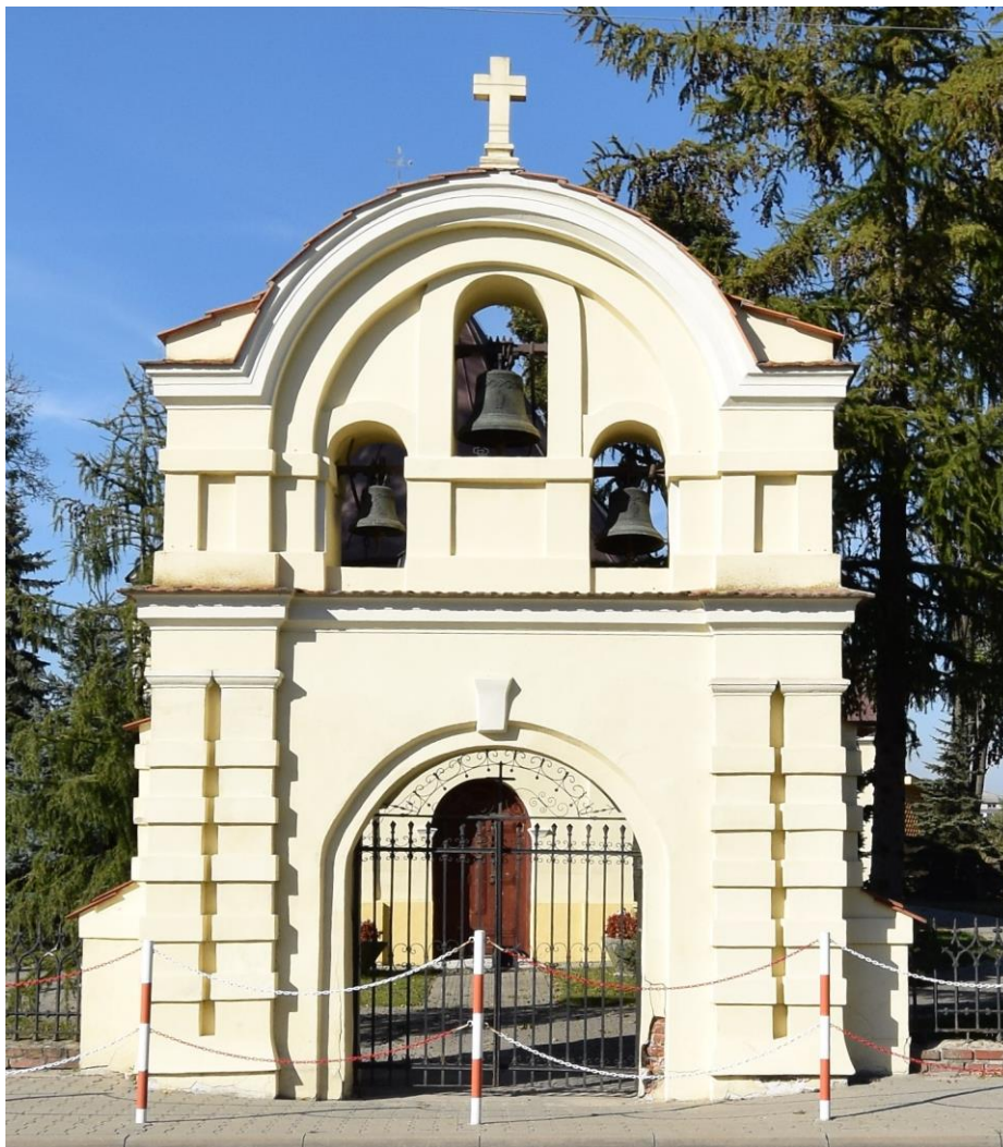
Widok od południowego wschodu

8. Fotografia z opisem wskazującym orientację albo mapa z zaznaczonym stanowiskiem archeologicznym