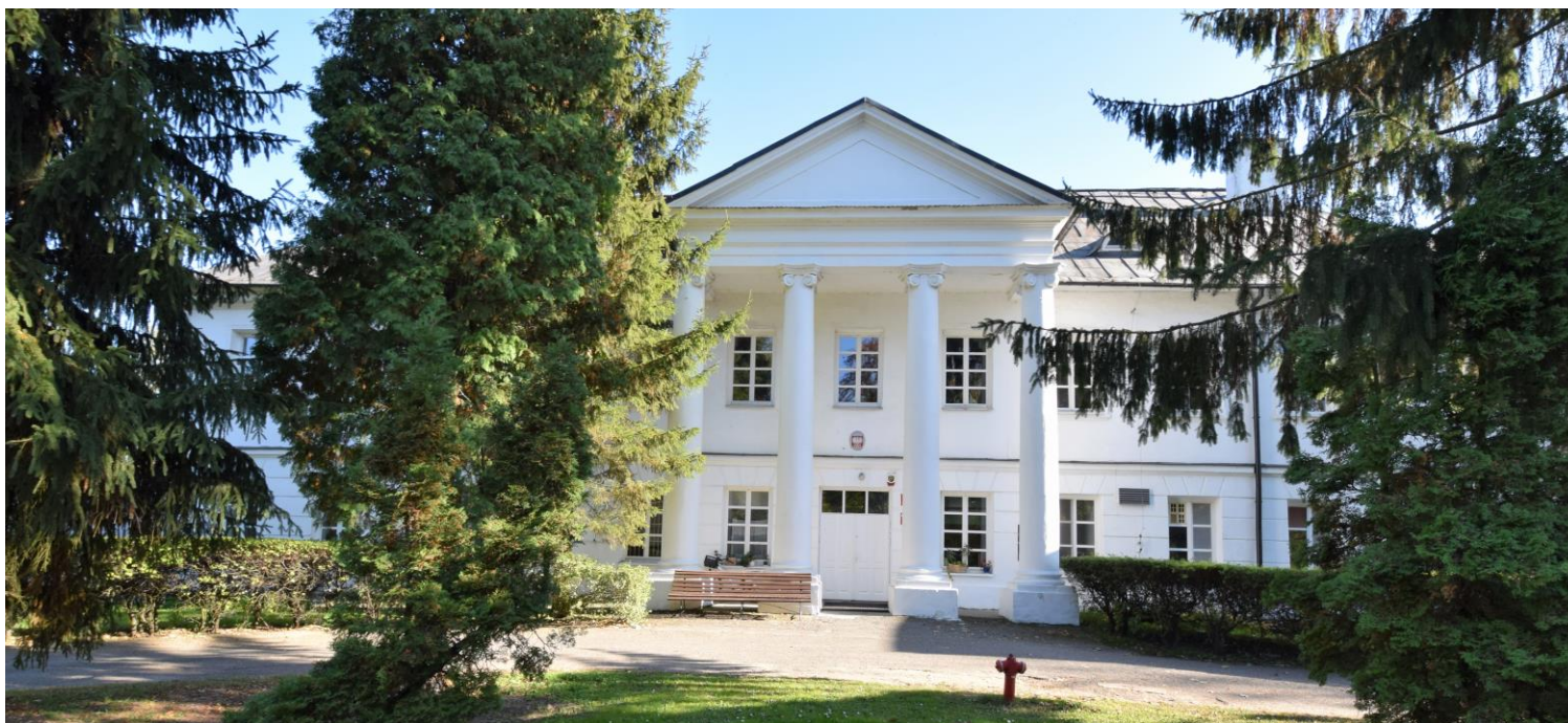
Widok od północnego zachodu

8. Fotografia z opisem wskazującym orientację albo mapa z zaznaczonym stanowiskiem archeologicznym