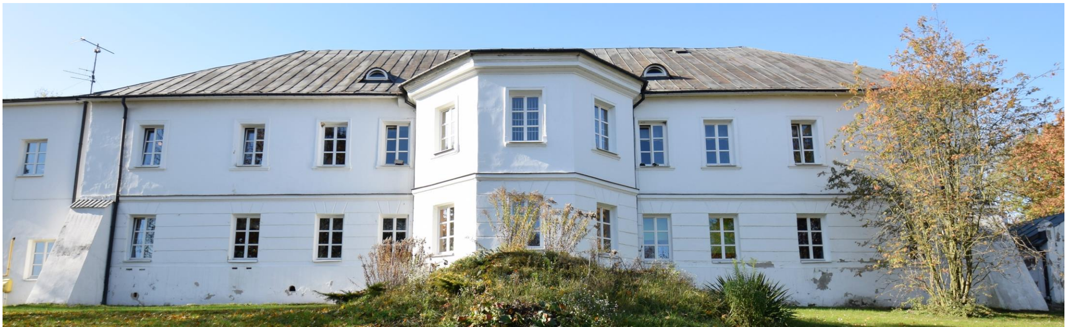
Widok od południowego wschodu