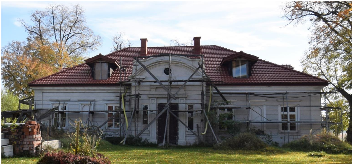
Widok od zachodu

8. Fotografia z opisem wskazującym orientację albo mapa z zaznaczonym stanowiskiem archeologicznym