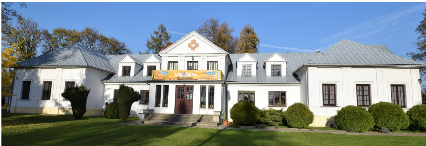
Widok od południowego zachodu

8. Fotografia z opisem wskazującym orientację albo mapa z zaznaczonym stanowiskiem archeologicznym