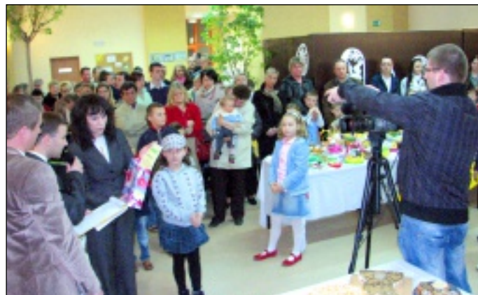
Ogłoszenie wyników konkursu zorganizowanego przez Gminne Centrum Kultury i Sportu na palmę, pisanke i ciasto wielkanocne