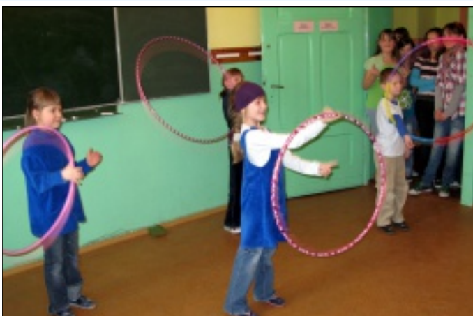
Dzieci prezentowały różnorodne umiejętności

Do współzawodnictwa przystąpiło 13 grup. Uczestnicy prezentowali swoje umiejętności najlepiej jak potrafili. Były tańce, śpiew, granie na instrumentach, kręcenie hoola-hop, a także recytacja wierszy.