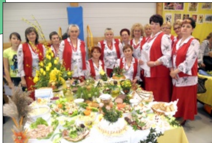
Koło Gospodyń Wiejskich z Łazan ze swoimi potrawami w trakcie prezentacji w Marcinowicach.