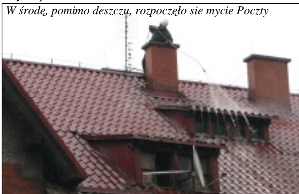
W środę, pomimo deszczu, rozpoczęło się mycie Poczty

Dlatego od wielu tygodni wspierane są działania grupy osób bezrobotnych, którzy zakładają spółdzielnię socjalną. Spółdzielnia zajmować się będzie, na zlecenie gminy, właśnie utrzymywaniem porządku.