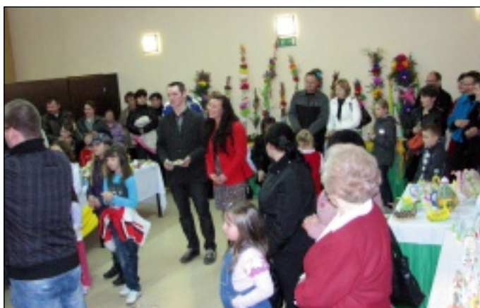
Oczekiwanie na wyniki

ła do obejrzenia trzech wystaw, towarzyszących pokonkursowej paradzie zdolności: „Pisanek i Palmy” – florystki