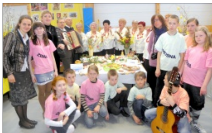
Dzieci ze Świetlicy „Cztery pory roku” wraz z przedstawicielami żarowskiego Związku Emerytów rencistów i Inwalidów w trakcie prezentacji w Marcinowicach