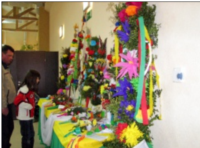
Palmy zgłoszone do konkursu