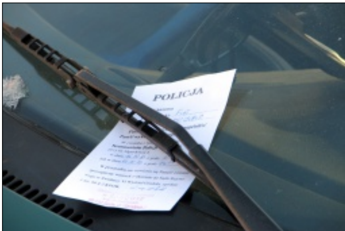
Takie kartki (wezwanie na Komisariat) mogą zobaczyć właściciele samochodów parkujących tuż przy przejściu dla pieszych

W pierwszej kolejności podjęto ustalenia w sprawie lepszego