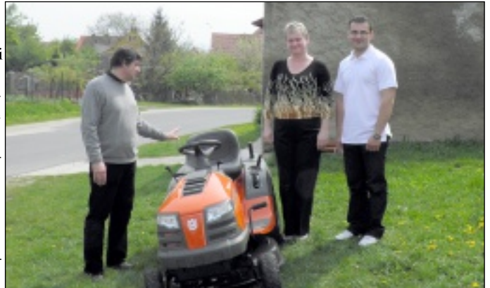
Kronika Filmowa Gminy Żarów ogółem w Internecie – https://kronika.um.żarów.pl