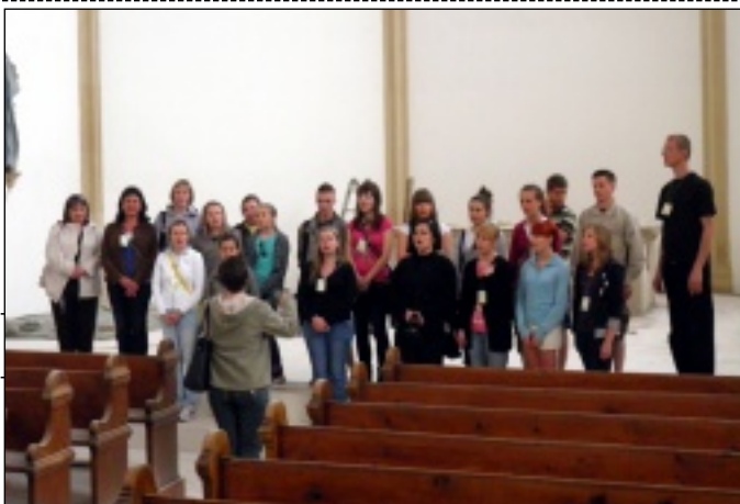
Występ w kościele Batory

W niedzielę 1 maja chór śpiewał najpierw w Kościele Greko-Katolickim, a później w Rzymsko-Katolickim, w którym koncert trwał ponad 40 minut. Koncert wypełniony był licznymi brawami i prośbami o bis. Zwieńcze-