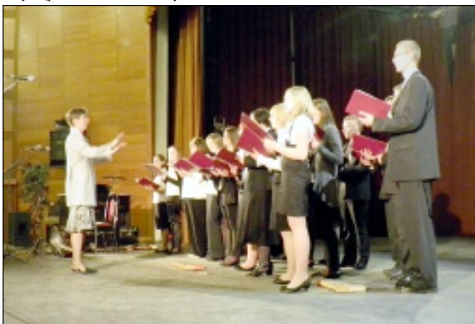
Występ w Domu Kultury w Újfehértó