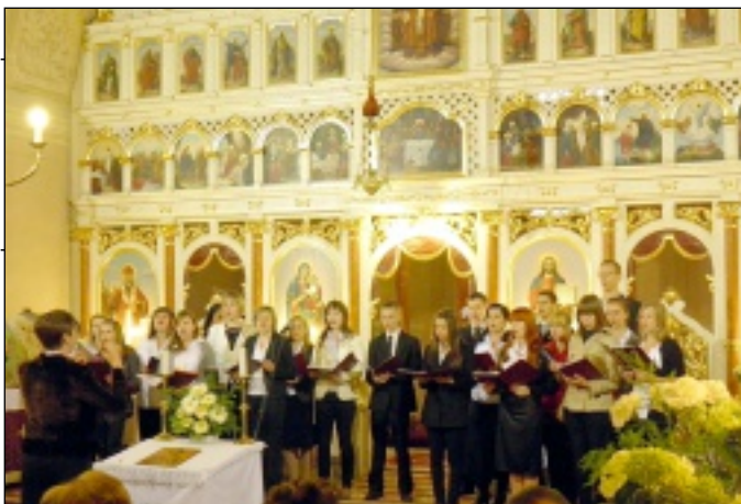
Występ w Cerkwi w Újfehértó

niem występu było wykonanie pieśni pt. „Baraka”, która w dniu beatyfikacji Jana Pawła II przypominała historię jego życia. Wszyscy odczuwaliśmy ogromne wzruszenie.