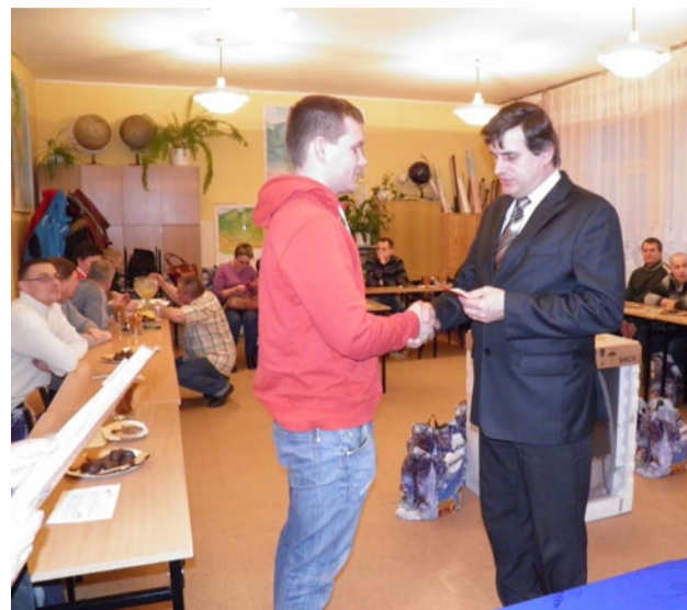
W przyszłym roku Klub Honorowych Dawców Krwi w Żarowie świętować będzie czterdziestolecie swojego funkcjonowania.