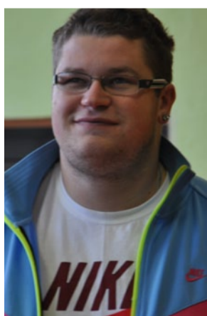
Paweł Fajdek, olimpijczyk w rzucie młotem

Dzisiaj zajęcia odbywają się na boisku, na którym ćwiczyli jeszcze rodzice, a nawet dziadkowie naszych uczniów. To bardzo wysłużony obiekt i niestety, już nie do końca bezpieczny, często zajęcia tu kończą się urazami. Bieżnia tartanowa na pewno pozwoli mi lepiej przygotowywać moich uczniów do startów w zawodach. Do tej pory takie obiekty mogli podziwiać tylko na zawodach w innych miastach. Myślę, że nowy obiekt stworzy możliwości rozwoju uczniów oraz nauczycieli. Na pewno będzie to miejsce, w którym dzieci będą spędzały wolny czas, chętniej też będą przychodziły na zajęcia.