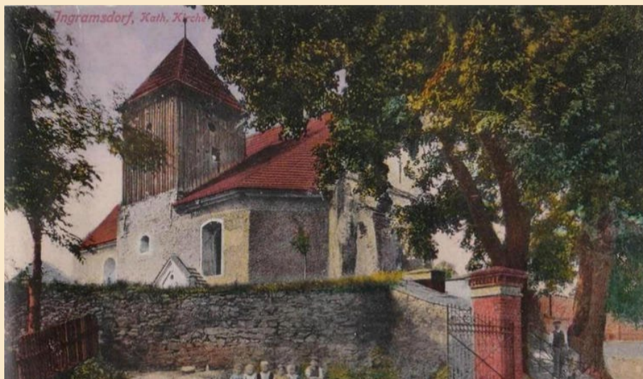
Imbramowice. Kościół lata 1913-1915 lub Imbramowice Kościół ok 1942

W wielu opracowaniach data 1522 figuruje jako moment powstania tej świątyni. Te cyfry wyryte zostały nad wejściem do pomieszczenia w dolnej kondygnacji czworobocznej wieży, które do czasu dobudowania kaplicy prawdopodobnie pełniło funkcję zakrystii kościoła. Najstarszymi elementami architektury oraz wyposażenia wnętrza kościoła są: kamienne gotyckie sakramentarium z XV w. oraz gotycki portal – boczne