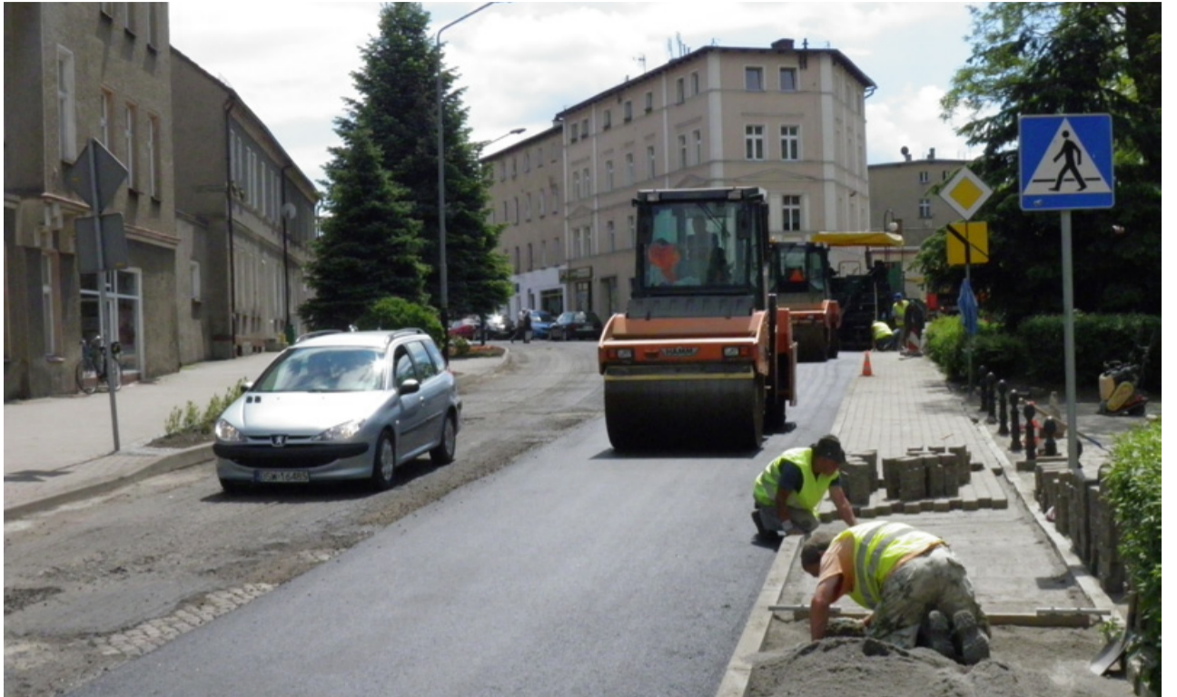
W ostatnich dniach zakończyła się trwająca ponad tydzień całkowita wymiana nawierzchni głównej, Armii Krajowej

przy Szkole Podstawowej. Wartość inwestycji to ponad 67 tysięcy złotych. Pozostały, mniej zniszczony, odcinek drogi został załatany. Jednocześnie rozpoczął się pozimowy remont dróg gminnych w mieście oraz w poszczególnych miejscowościach. - W połowie maja poprawił się również stan nawierzchni drogi przy ulicy Dworcowej w Żarowie. Pracownicy Świdnickiego Przedsiębiorstwa Budowy Dróg i Mostów załatali ubytki w jezdni powstałe na skutek zniszczeń ciężkiego transportu. Po na-