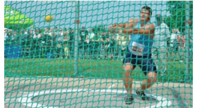
Paweł Fajdek podczas meczu Polska - Reszta Świata

Czeska Ostrava tym razem nie przyniosła zadowolenia Pawłowi Fajdkowi. To tutaj młociarz po raz pierwszy w karierze przekroczył granicę 80m oraz zdobył tytuł Młodzieżowego Mistrza Europy.