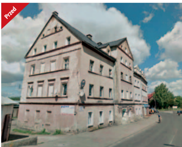
Przed remontem budynek przy ulicy Armii Krajowej 25 nie był dobrą wizytówką Żarowa