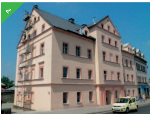
Po remoncie budynek przy ulicy Armii Krajowej 25 zyskał nową elewację

mieszkalniowych w Żarowie ogłoszona została dopiero rok później. Pozytywna wiadomość dotarła do mieszkańców tuż pod koniec ubiegłorocznych wakacji. – Warto jednak było czekać tak długo. Dziś możemy powiedzieć, że nie mieszkamy już w tym „czymś”, tylko w pięknym budynku przy ulicy Kwiatowej w Żarowie. Każdy,