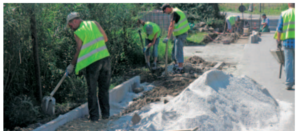
Wszystkie prace przy budowie chodników w gminie Żarów, zgodnie z zapisami porozumienia potrwać do końca listopada.

Droga powiatowa, przy której powstaje właśnie nowy chodnik to droga bardzo ruchliwa. Wciąż mijają się na niej samochody ciężarowe i przez ten fakt, na pewno dochodzi do nowych zniszczeń. Jednak od teraz mieszkańcy Imbramowic będą mogli czuć się bezpieczniej. Cieszę się, że chodnik powstaje właśnie w tym miejscu i poprawi bezpieczeństwo nie tylko mieszkańców, ale również uczestników ruchu drogowego.