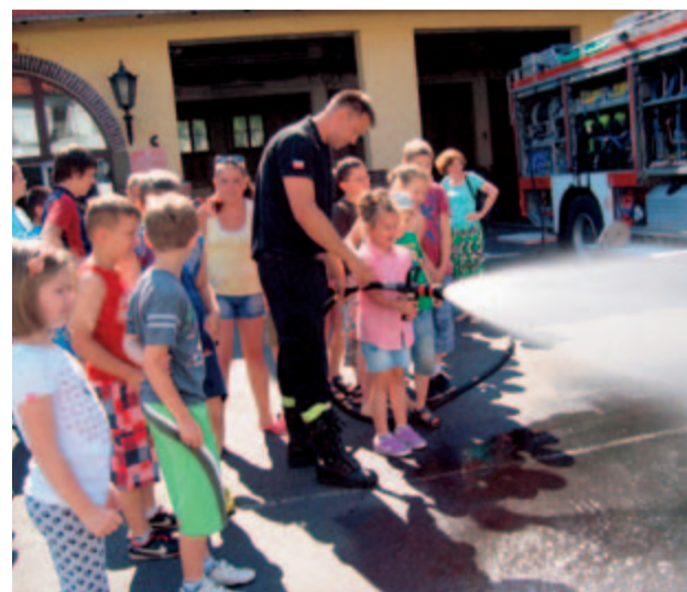
Oprócz wycieczek krajoznawczych młodzi półkoloniści uczestniczyli również w zajęciach profilaktycznych. Na zdjęciu wizyta w świdnickiej Państwowej Straży Pożarnej.