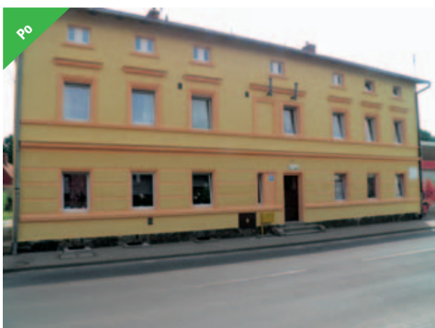
Dziś budynek przy ul. Armii Krajowej 24 w Żarowie prezentuje się już bardziej okazale