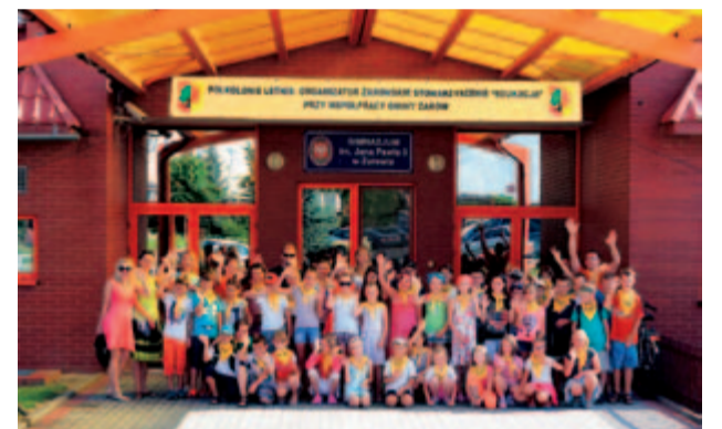
W tym roku w wakacyjnych półkoloniach organizowanych przez Żarowskie Stowarzyszenie „Edukacja” uczestniczyło 150 najmłodszych mieszkańców gminy Żarów.

Zajęcia w ramach wycieczki organizowane przez „Edukację” łączą w sobie i dobrą zabawę, naukę i rozwijanie pasji, a także wdrażają do aktywnego trybu spędzania czasu. Przy wsparciu finansowym gminy Żarów, która na realizację tego przedsięwzięcia przeznaczyła dotację w wysokości 40 tysięcy złotych najmłodszym uczestnikom udało się przeżyć prawdziwie wakacyjną przygodę. – Półkolonie to najlepsza forma wycieczki dla dzieci i dobry sposób na spędzenie czasu kreatywnie, twórczo, radośnie i ciekawie. Zapewniamy dzieciom mnóstwo atrakcji. W programie jest dużo wycieczek, wyjazdy na basen, a także zajęcia, które rozwijają aktywność dzieci i mają wartość edukacyjną. I co najważniejsze na półkoloniach brak jest miejsca na nudę. W tym roku w wakacyjnym