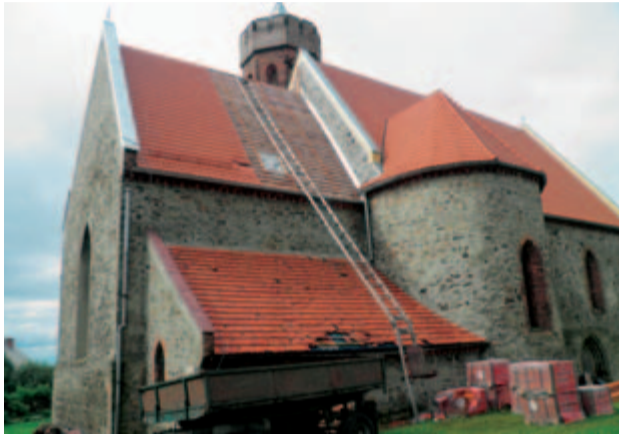
Prace remontowe w zabytkowym kościele w Pożarzysku potrwać do końca sezonu wakacyjnego.