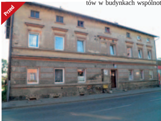
Tak przed remontem wyglądał budynek przy ul. Armii Krajowej 24 w Żarowie

Intensywne prace nad projektem trwały prawie dwa lata. Oficjalnie decyzja o przyznaniu dofinansowania remontów w budynkach wspólnot