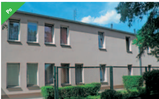
Na taki wygląd budynku mieszkańcy ulicy Kwiatowej w Żarowie czekali od dawna