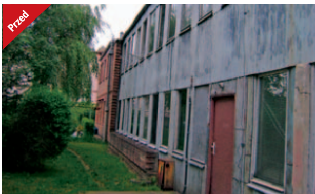
Budynek przy ulicy Kwiatowej w Żarowie już od dawna wymagał kapitalnego remontu