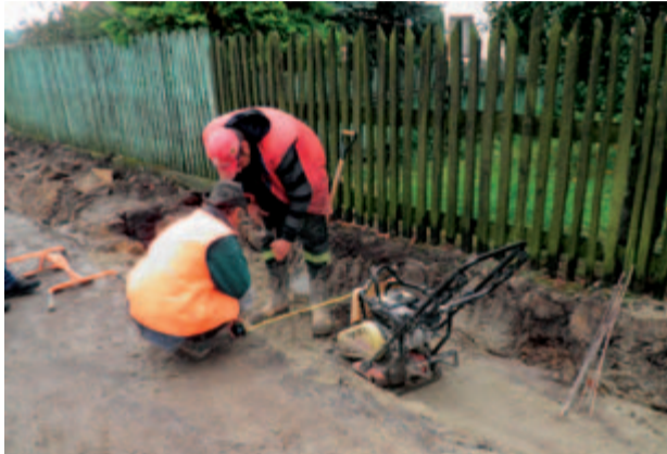
Blisko 8 tysięcy złotych kosztowała budowa nowego chodnika w Siedlimowicach. Środki finansowe na ten cel pochodziły z budżetu gminy Żarów. Decyzją mieszkańców pieniądze na budowę nowego chodnika zostały przeznaczone z puli środków funduszu sołeckiego