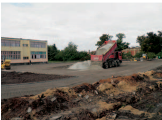
Niesprzyjająca aura atmosferyczna nie przeszkodziła w pracach przy budowie boiska lekkoatletycznego. Już dziś widać, jak będzie wyglądał nowy plac sportowy.

Na nowym boisku lekkoatletycznym w Żarowie znajdą się stanowiska do uprawiania konkretnych dyscyplin. Z czterotorowej bieżni lekkoatletycznej z nawierzchnią syntetyczną, sześciotorowej bieżni do sprintu, skoczni w dal z 40-metrowym rozbiegiem, stanowiska do pchnięcia kulą i boiska wewnątrz bieżni uczniowie żarowskich szkół korzystać będą już pod koniec października. – Nowy obiekt posłuży nie tylko dzieciom i młodzieży. Mamy usportowionych mieszkańców, więc zapewne i oni szlifować będą tam