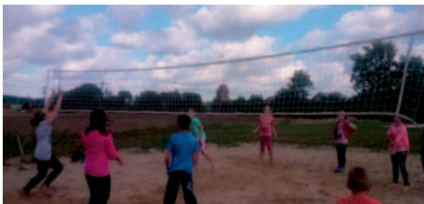
Na nowym boisku będą organizowane różne turnieje. Być może kibice, już w najbliższym czasie uczestniczyć będą w meczu samorządowców i Rady Sołeckiej Kalna?

Z nowego boiska do siatkówki najbardziej cieszą się najmłodsi mieszkańcy Kalna. Piłkarze i gimnazjaliści również wspomagali budowę nowego obiektu sportowego. – Już trwają tam treningi i sportowe rozgrywki. I zapewne trwać będą tak długo,