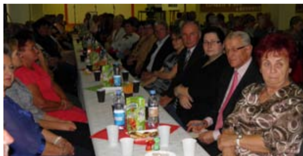
W przyszłym roku studenci Uniwersytetu Trzeciego Wieku w Żarowie świętować będą jubileusz pięciolecia funkcjonowania uczelni

W szeregi uczelni wstąpiło już ponad 130 chętnych słuchaczy. Lista zapisów wciąż jest jeszcze otwarta. – Kiedy odwiedzają nas przedstawiciele innych dorosłych uczelni, wszyscy dziwią się, że nasi studenci mogą „kształcić” się w tak dobrych warunkach. Bezpłatnie użyczamy lokale i pomieszczenia, w których odbywają się nasze spotkania i korzystamy również z współfinansowanych zajęć. To efekt dobrej współpracy z burmistrzem Żarowa