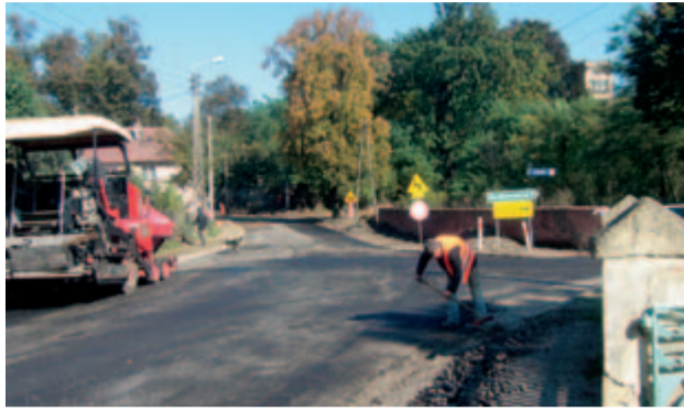
Mieszkańcy Mrowin odetchnęli z ulgą. Droga powiatowa nr 2880D będąca pod zarządem Starostwa Powiatowego w Świdnicy w końcu doczekała się modernizacji.

nia drogowa poprawi bezpieczeństwo mieszkańców i użytkowników ruchu drogowego. Dzięki staraniom gminy Żarów na tym odcinku powstało również nowe oświetlenie, które sfinansowane zostało ze środków budżetu gminy oraz wyodrębnionego w jego ramach funduszu sołeckiego. - Nie było pilniejszego remontu w Mrowinach niż remont drogi powiatowej, która nie nadawała się już do użytku zewnętrznego. Tym razem nie trzeba było wspierać powiatu w jego pracach, choć na budowę nowego oświetlenia środki finansowe pochodziły z budżetu gminy Żarów. Droga biegnąca przez Mrowiny jest drogą powiatową, a każdy właściciel odpowiada za swoją własność. Gmina Żarów również jest właści-