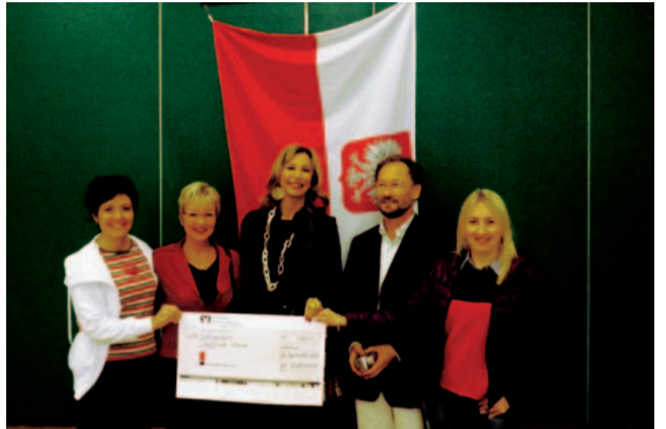
Uroczyste przekazanie czeku opiewającego na 300 Euro. Suma ta została przeznaczona na dodatkowe atrakcje dla młodzieży uczestniczącej w programie wymiany.

Jak efektywnie zdobywać kompetencje europejskie i uczyć się języków obcych? W jaki sposób skutecznie walczyć ze stereotypami? I jak robić to w miły i przyjemny sposób?