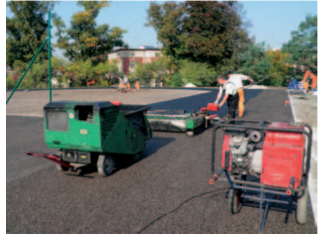
Na nowym obiekcie lekkoatletycznym znajdzie się czterotorowa bieżnia lekkoatletyczna z nawierzchnią syntetyczną, sześciotorowa bieżnia do sprintu, skocznia w dal z 40-metrowym rozbiegiem, stanowiska do pchnięcia kulą i boisko wewnątrz bieżni. Z nowoczesnej bazy sportowej będzie można korzystać już pod koniec października.

burmistrz Leszek Michalak . Budowa nowoczesnego