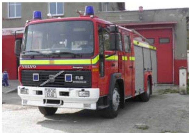
Rok 2013 poprawił znacznie kondycję trzech kolejnych jednostek OSP. Do strażaków z Imbramowic trafił wóz Jelcz, w Kalnie stary Żuk został wymieniony na nowy wóz Lublin, a druhowie z OSP Mrowiny wzbogacili się o samochód Man 8.136 F. Na zdjęciu samochód Volvo FL 6, który jest nowym nabytkiem żarowskich strażaków

Tak wyposażony samochód pożarniczy Volvo FL 6 z 1998 roku w piątek, 11 października trafił do druhów z żarowskiej jednostki Ochotniczych Straży Pożarnych. - Jest nowoczesny, dobrze wyposażony i służyć będzie z daleka. Nowy nabytek, który kupiony został w Łągowicach kosztował 60 tysięcy złotych i jest drugim, obok wozu strażackiego Steyr samochodem pożarniczym jednostki w Żarowie. Pieniądze na jego zakup pochodziły z budżetu gminy Żarów, żarowskiego zakładu Polskiej Ceramiki Ogniotrwałej