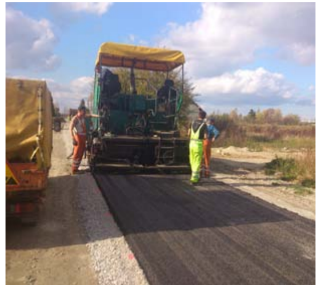
Mieszkańcy Kalna mogą już cieszyć się nową nawierzchnią drogową. Remont drogi zakończył się tam w ubiegłym tygodniu.

Mieszkańcy, a przede wszystkim rolnicy z Krukowa, Pyszczyzna, Gołaszyc, Mikoszowej i Marcinowiczek mogą się poruszać zmodernizowanymi drogami. Tam, w ubiegłym roku remontu doczekały się drogi dojazdowe do gruntów rolnych. Dziś, na nowe nawierzchnie czekają również rolnicy z terenu innych miejscowości w gminie Żarów. – Dbamy o to, aby mieszkańcy z terenu gminy Żarów mogli w mia-