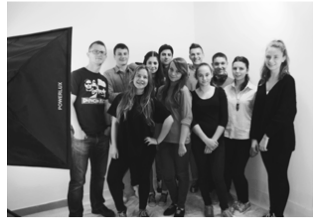
Żarowski gimnazjaliści aktywnie włączyli się w udział konkursu filmowego „Tesco dla szkół-talent do niemarnowania”. Na zdjęciu reprezentanci gimnazjum im. Jana Pawła II w Żarowie

P racują w pocie czoła. Uczą się filmowych ról i prawidłowej intonacji oraz dykcji. W tym zawodzie ważna jest również odpowiednia postawa. A wszystko w ramach konkursu filmowego ogłoszonego przez sieć sklepów Tesco, w którym uczestniczy młodzież żarowskiego gimnazjum.