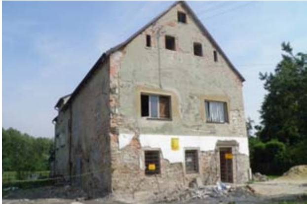
Tak przed remontem wyglądał budynek świetlicy wiejskiej w Krukowie.

P rzez lata niezagospodarowana, niszczała i straszyla. Dziś odzyskała swój dawny blask. Odnowiona i unowocześniona świetlica wiejska w Krukowie znów ma być miejscem spotkań i budowania relacji między mieszkańcami. Miejscem, gdzie będzie kultywowana tradycja wsi i krzewienia kultury.