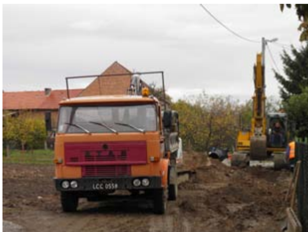
Budowa sieci wodociągowej i kanalizacyjnej, które powstaną na terenie gminy Żarów kosztować będzie ponad 7 milionów złotych. W tej chwili prace trwają na terenie Wierzbnej.