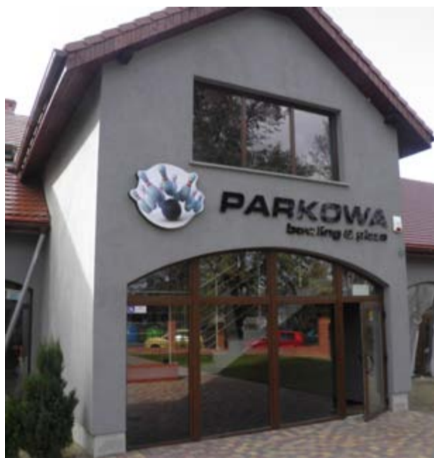
Niegdyś w budynku nowej kręgielni w Żarowie mieściła się restauracja i hotel Parkowa. Dziś odrestaurowany budynek zupełnie zmienił swój wizerunek.

Nowa kręgielnia mieści się przy ul. Zamkowej 3 w Żarowie i otwarta jest od poniedziałku do czwartku w godz. 12.00-22.00,