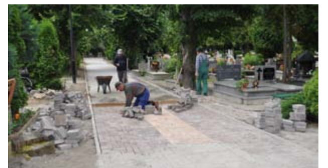
W dniu 1 listopada cmentarz komunalny w Żarowie odwiedzą tłumy mieszkańców gminy Żarów. Wśród nich będą zapewne tacy, którzy w rodzinne strony przyjadą z bardzo daleka.

Uporządkowany i wyposażony w kolejne alejki cmentarne, które w poprzednim i tym roku wyremontowała gmina Żarów znów nabrał nowego wyglądu. Odwiedzający groby nie będą się już musieli martwić, że ugrzęzną w błocie. – W minionym roku ze środków finansowych budżetu gminy Żarów wyposażono cmentarną kaplicę w nowy sprzęt nagłaśniający, a na terenie samego cmentarza, dzięki pozyskanym środkom zewnętrznym wykonano remont nawierzchni alejek. Dziś jesteśmy już na etapie zrealizowania drugiej części tej inwestycji. A wszystko po to, aby by-