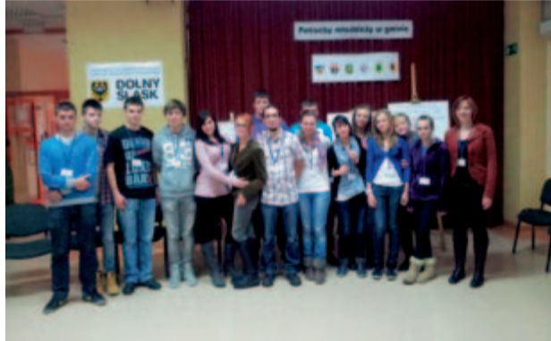
Na zdjęciu przedstawiciele Młodzieżowej Rady Miejskiej podczas konferencji „Potrzeby młodzieży w gminie” w żarowskim Gminnym Centrum Kultury i Sportu.