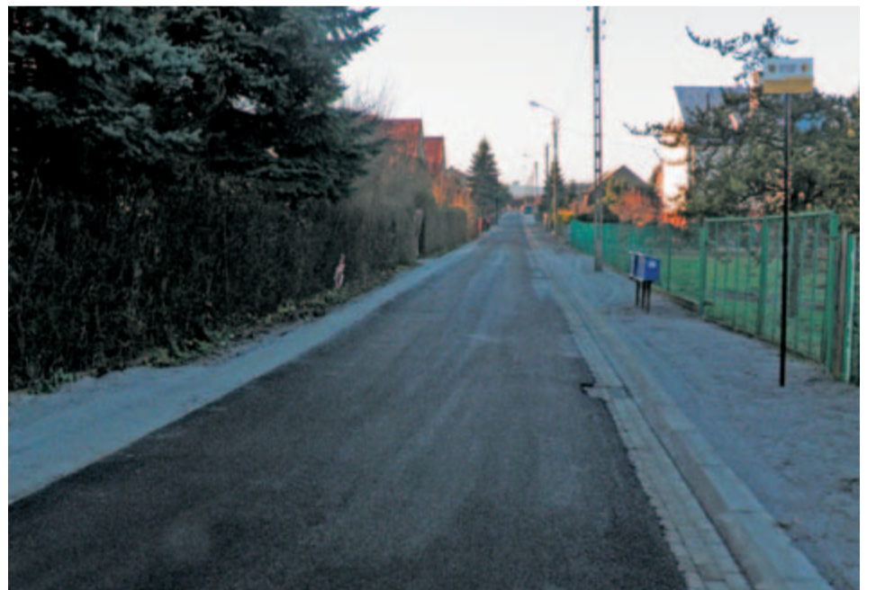
Tak po kapitalnym remoncie wygląda nowa droga przy ulicy Kolejowej w Mrowinach