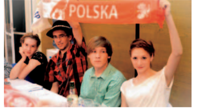
Żarowscy młodzieżowi radni podczas wyjazdu na Filipiny uczestniczyli w europejskim projekcie „Międzynarodowa Konwergencja Młodzieżowa na temat zatrudnienia, bezrobocia i edukacji. Jej głównym pomysłodawcą było Stowarzyszenie Semper Avanti z Wrocławia.

Sam nie byłem pewny, czy jestem w stanie uiścić tę kwotę, ponieważ wynosiła 1080 złotych, co dla ucznia to dość spora kwota. Burmistrz Żarowa osobiście znalazł mi prywatnego sponsora, który opłacił mi ten wyjazd, za co jestem bardzo