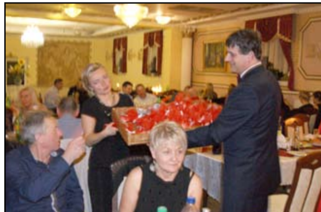
W przyszłym roku uczestnicy bawić się będą na piątym już, jubileuszowym balu charytatywnym.

Mieszkańcy Żarowa i nie tylko już od czterech lat bawią się na charytatywnym balu, aby wesprzeć finansowo Szkołę Podstawową im. Jana Brzechwy w Żarowie.