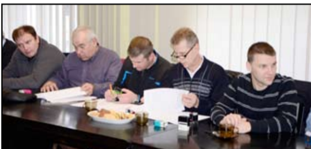
Na zdjęciu przedstawiciele żarowskich klubów sportowych.

W tegorocznym budżecie na zadania z zakresu sportu gmina Żarów przeznaczyła 165 tysięcy złotych. To o 17 tysięcy więcej niż dwa lata temu. Pie-