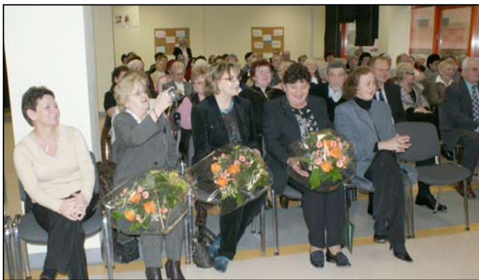
17 marca 2009 roku, inauguracja UTW