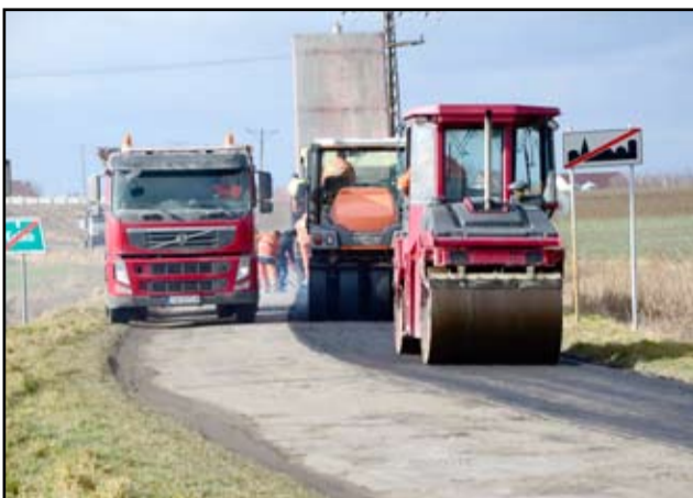
Budowa kanalizacji to jeden z największych projektów prowadzonych w gminie Żarów. Zakres prac jest szeroki i wiąże się również z robotami ziemnymi na odcinkach istniejących dróg. Po ułożeniu rur kanalizacyjnych firma remontowa w każdej miejscowości, w której budowana jest nowa kanalizacja odtwarzać będzie naruszone nawierzchnie drogowe. Tak jak to miało miejsce na odcinku drogi Bożanów-Kalno.