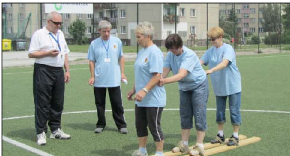
Rywalizacja zespołowa Studentów