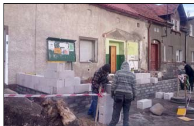
Prace remontowe przy rozbudowie wiejskiej świetlicy w Kalnie nabierają coraz większego tempa. I jeśli pogoda nadal będzie sprzyjała, inwestycja powinna zakończyć się już pod koniec marca.