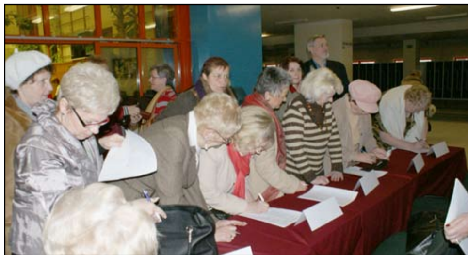
Zapisy pierwszych Studentów