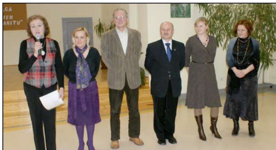
Pierwsza Rada Programowa UTW