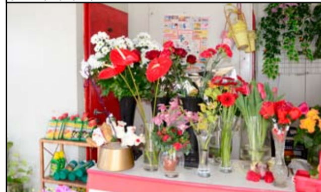
Kwiaciarnia przy ul. Armii Krajowej 52 w Żarowie istnieje już 31 lat. Można tu niedrogo kupić różnego rodzaju kwiaty i ozdoby. Kwiaciarnia znajduje się w centrum miasta, jednak jej budynek może odstraszać samych klientów. W okresie wakacyjnym kwiaciarnię czekają zmiany, bo jej właścicielka zdecydowała się na mały remont.