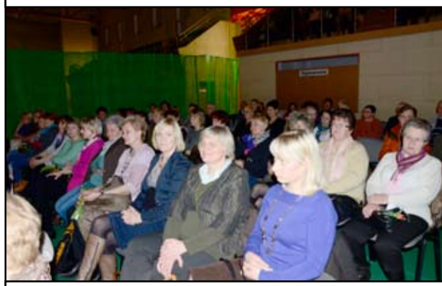
To był wyjątkowy Dzień Kobiet! Na hali sportowej Gminnego Centrum Kultury i Sportu próżno było szukać wolnego miejsca.