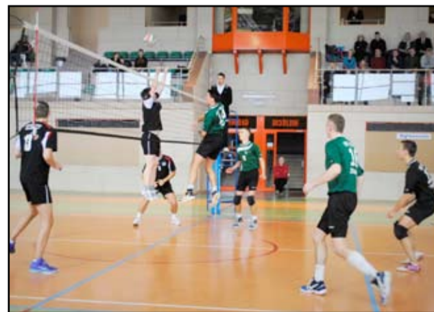
W najbliższym sezonie klub sportowy Volley Żarów uczestniczyć będzie w licznych rozgrywkach, III lidze seniorów oraz lidze kadetów.

- Moje wymagania jako trenera są bardzo wysokie. Nie