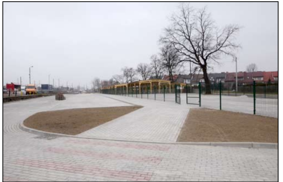
Modernizacja miejskiego targowiska przy ulicy Dworcowej w Żarowie kosztować ma 850 tysięcy złotych, z czego 500 tysięcy złotych to dotacja unijna, którą gmina Żarów pozyskała z Programu Rozwoju Obszarów Wiejskich.