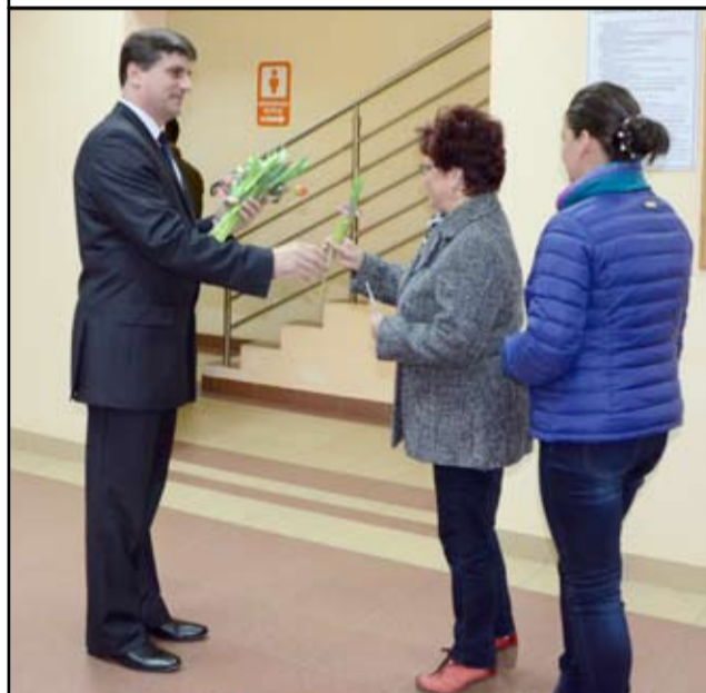
Wszystkie panie zostały obdarowane kwiatami, które wręczał im burmistrz Leszek Michalak.