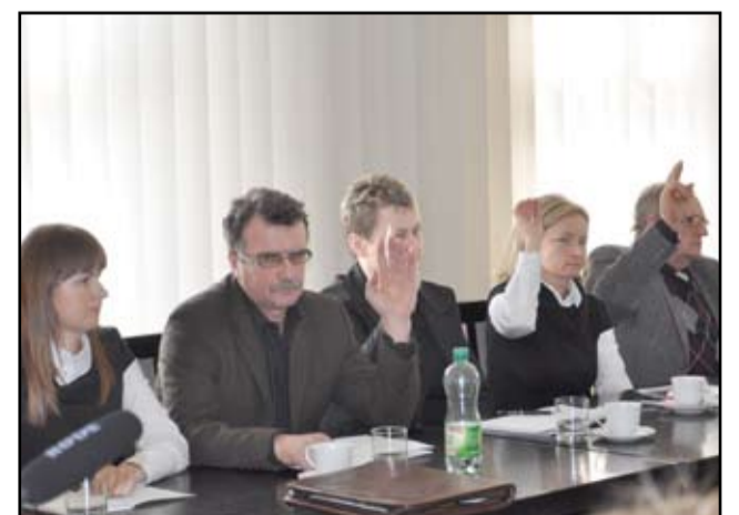
Mieszkańcy gminy Żarów wciąż będą mogli liczyć na wsparcie w zakresie dożywiania. Żarowscy radni Rady Miejskiej podczas sesji, 6 lutego podjęli uchwały pozwalające na realizację tego programu.