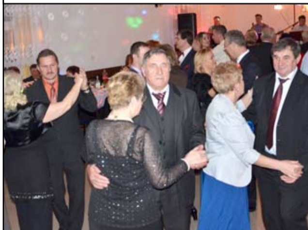
Taki bal w gminie Żarów odbywa się nieprzerwanie od dwudziestu lat.

T radycją jest już zabawa na cześć tych, którzy organizują życie mieszkańców we wsiach gminy Żarów. Ponad sto dwadzieścia osób bawiło się w sobotę, 1 marca na tegorocznym Balu Sołtysa.