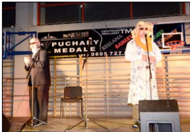
Marian i Hela – najbardziej znana kabaretowa para w Polsce. Na żywo z okazji Dnia Kobiet wystąpili w żarowskim Gminnym Centrum Kultury i Sportu.

Więcej zdjęć znajdziesz na www.um.zarow.pl