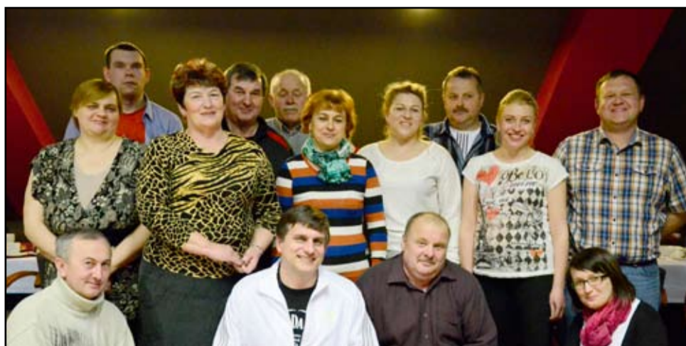
W Sołeckim Turnieju w Kręgle uczestniczyli reprezentanci Zastruża, Bukowa, Pyszczyzna, Siedlimowic, Łażan, Kalna, Przylęgowa, Mikoszowa, Imbramowic, Wierzbnej, Marcinowiczek i Mielęcina.