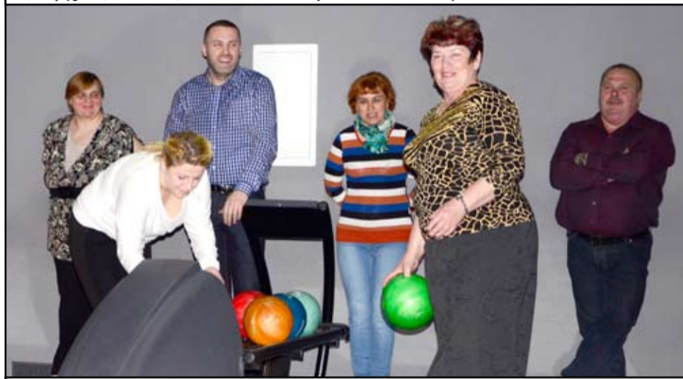
Sołtysi z gminy Żarów rywalizowali ze sobą już nie pierwszy raz. Corocznie spotykają się również na turnieju wsi.