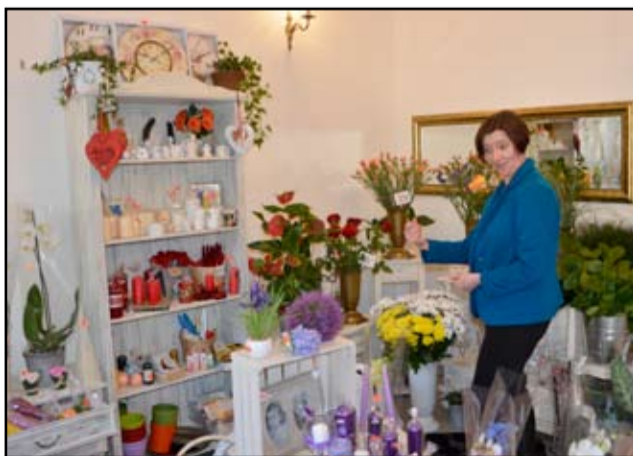
Nie ma takiego dnia, żeby klienci nie zaglądali do „Bukieciarni” w Żarowie. Mieszkańcy mogą tutaj również składać swoje indywidualne zamówienia.

- Naszym najmocniejszym konkurentem stają się supermarkety, które często oferują klientom sprzedaż kwiatów za mniejszą cenę. Jednak najważniejsza jest kwestia ekspozycji, czyli zapre-