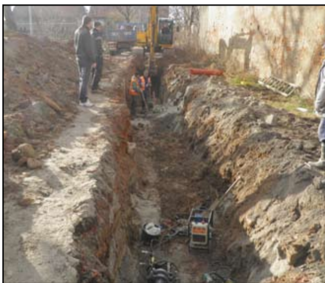
Zgodnie z podpisaną umową, inwestycja ma się zakończyć do końca 2014 roku. Po Bożanowie przyszedł czas na prace przy rozbudowie kanalizacji w Wierzbnej.

W ramach całej inwestycji wymieniona zostanie sieć wodociągowa w miejscowości Bożanów oraz wybudowana sieć kanalizacyjna we wsiach Wierzbna i Bożanów z przesyłem w kierunku Kalna. Całość zostanie podłączona do sieci kanalizacyjnej w Żarowie. Dzięki sprzyjającej aurze wszystkie prace postępują sprawnie. – Przy dużych mrozach ciężiej jest wykonywać wszelkie roboty ziemne. I materiały budowlane szybciej niszczej,