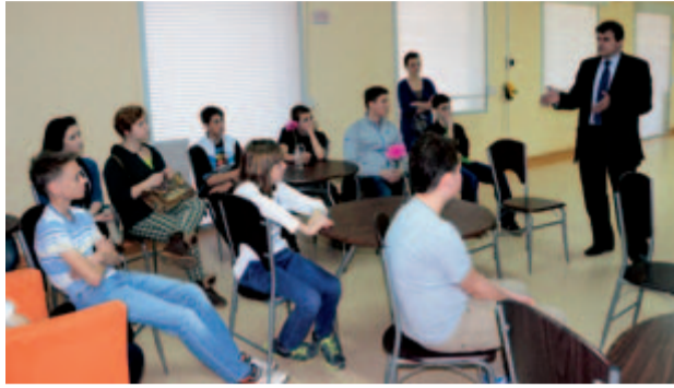
O tym, jak będzie wyglądał skatepark w Żarowie decydowała sama młodzież.