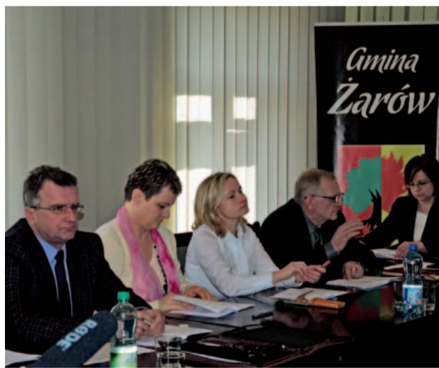
Żarowski radni na ostatniej sesji Rady Miejskiej wstrzymali się od głosu za wprowadzeniem nowych stawek za wodę i ścieki. Zgodnie z prawem będą one obowiązywały już od 1 maja 2014 roku.

W oda w Żarowie dalej będzie najtańsza w powiecie. Od 1 maja obowiązywać zaczną nowe stawki za zbiorowe zaopatrzenie w wodę i odprowadzanie ścieków. Nowa taryfa będzie obowiązywała w terminie od 1 maja 2014 roku do 30 kwietnia 2015 roku. Zgodnie z jej zapisem odbiorcy wody z urządzeń wodociągowych za jeden metr sześcienny zapłacą 3,25 złotych. Do tej pory za jeden metr sześcienny wody płacono 3,16 złotych.