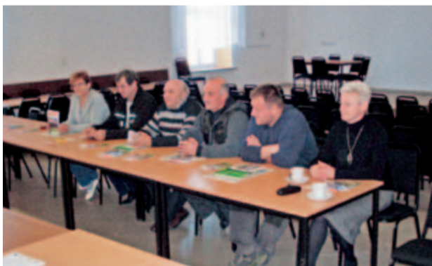
Nową wiedzę podczas szkolenia zdobywali rolnicy z terenu gminy Żarów.

W piątek, 21 marca na świetlicy wiejskiej w Bukowie, odbyło się szkolenie na temat bezpieczeństwa i higieny pracy robotników. Przeprowadzili je pracownicy Terenowego Oddziału Kasy Rolniczego Ubezpieczenia Społecznego w Świdnicy. Po zajęciach wypełniono testy sprawdzające.