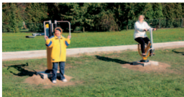
Na żarowskiej siłowni „pod chmurką” można dbać o zdrowie i kondycję bez żadnych ograniczeń. Już niebawem zmieni się również teren przy ścieżce zdrowia. Będzie estetyczniej i bardziej komfortowo.

Na pewno wpłynie to na jeszcze większe zainteresowanie plenerową siłownią, choć i tak cieszy się ona ogromną popularnością. – Żarowska siłownia pod chmurką ma już pół roku. I cieszy się niezmiernie dużym zainteresowaniem. Ćwiczenia na powietrzu to zdrowy sposób na spędzanie czasu. Ale ćwiczy się przyjem-