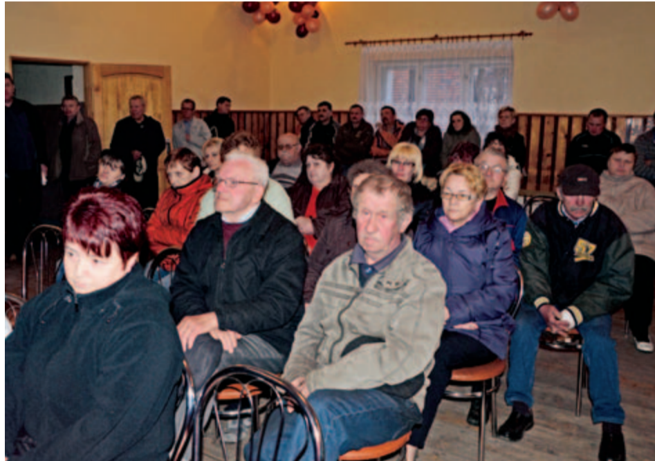
Na zebranie z burmistrzem Żarowa przybyli mieszkańcy Mrowin.