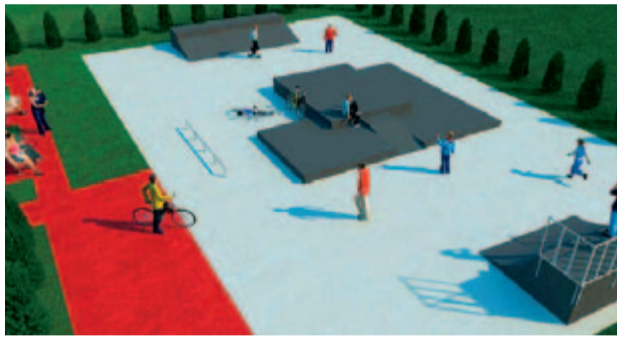
O takim miejscu żarowska młodzież marzy już od kilku lat. Przystronny skatepark, w którym amatorzy deskorolki i dwóch kółek mogliby szlifować swe akrobatyczne umiejętności już niebawem powstanie w Żarowie.