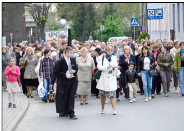
Żarowianie wspólnie świętowali kanonizację Jana Pawła II.