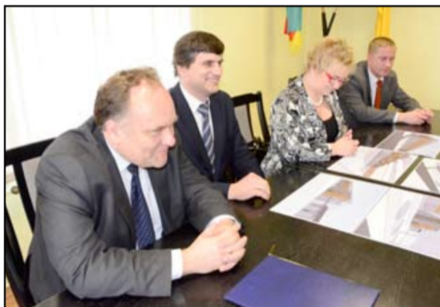
Jeszcze w tym roku, za niespełna dwa miesiące ruszy budowa basenu w Żarowie. Po wielu latach inwestycja zostanie dopełniona.