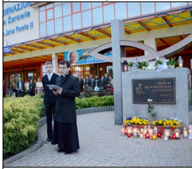
W niedzielę, 27 kwietnia cała Polska świętowała kanonizację papieża. W Żarowie, podobnie jak w wielu miejscach tego dnia rozblęły światełka Iskry Miłosierdzia. Mieszkańcy zanieśli je pod papieski pomnik przy żarowskim gimnazjum.