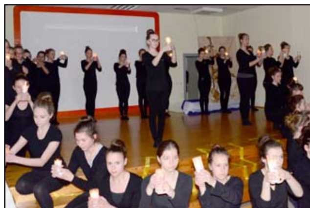
Żarowska młodzież dała wyraz temu, że pamięta i ma w sercach słowa Ojca Świętego. Specjalny montaż słowno-muzyczny przygotowany przez gimnazjalistów wzbudził wśród mieszkańców ogromne zainteresowanie.

Kanonizacja Jana Pawła II i Jana XXIII była pierwszą w tym stuleciu kanonizacją papieża. Ostatnim papieżem, który został wyniesiony w poczet świętych był Pius X. Było to 29 maja 1954 roku. Niedzielną kanonizacja była szczególnym dniem, bo papież Franciszek ogłosił świętymi jednocześnie dwóch swoich poprzedników, którzy dołączą do 482 osób, które sam Jan Paweł II ogłosił świętymi podczas swojego niemal 27-letniego pontyfikatu, jednego z najdłuższych w historii kościoła.