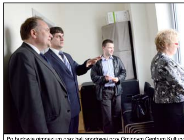
Po budowie gimnazjum oraz hali sportowej przy Gminnym Centrum Kultury i Sportu, basen będzie ostatnim etapem budowy całego kompleksu przy ul. Piastowskiej w Żarowie.