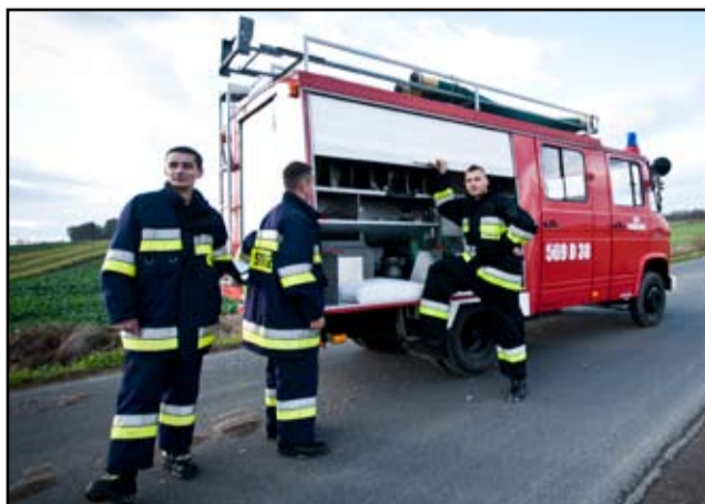
Jak twierdzą sami strażacy, ich praca jest niebezpieczna i trudna. Jest również źródłem satysfakcji i powodem do dumy.