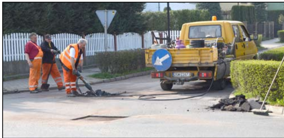
Wraz z budową nowego chodnika rozpoczęło się latanie pozimowych ubytków na gminnych drogach. Poza ulicą Dworcową i Wojska Polskiego, prace prowadzone będą na ulicy Puskina, Kwiatowej, Słowińskiej, Górniczej, Armii Krajowej i Piastowskiej. W planach jest także naprawa dróg na terenie wsi.