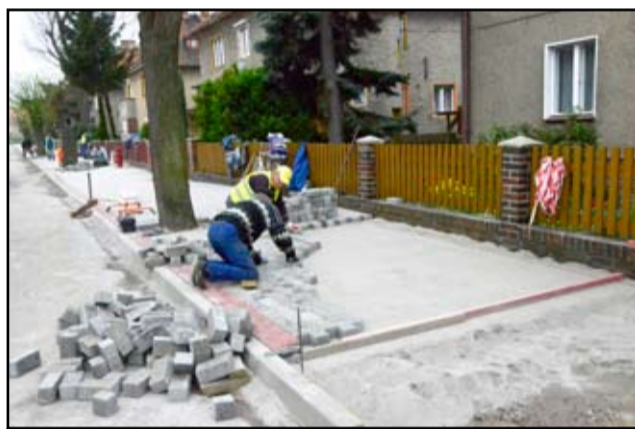
Nowy ciąg pieszki, który powstaje przy ulicy Dworcowej i Wojska Polskiego w Żarowie wykonany zostanie z kostki betonowej. A całość, od strony jezdni będzie zamknięta betonowym krawężnikiem. Chodnik przy ulicy Dworcowej w znacznej części został już poszerzony pod koniec 2013 roku.

A wszystko w trosce o bezpieczeństwo najmłodszych mieszkańców Żarowa, dla których ten odcinek stanowi główną drogę do szkoły. – Nowa nawierzchnia chodnikowa powstaje na wysokości od przejazdu kolejowego wzdłuż ulicy Dworcowej oraz na całej długości ulicy Wojska Polskiego, aż do skrzyżowania z ulicą 1 Maja. Łącznie na tym odcinku powstanie 1200 metrów kwadratowych nowego ciągu pieszego z kostki betonowej. Prace wykonują pracownicy robót publicznych i prac interwencyjnych. Remont pochłonie blisko 60 tysięcy złotych – wyjaśnia Patryk