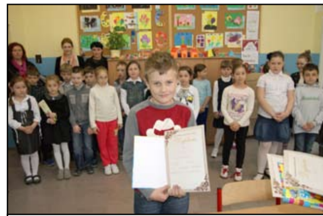
Uczniowie szkół podstawowych nie tylko pisali dyktando, ale także trudnili się nad zadaniami z ortografii i gramatyki.