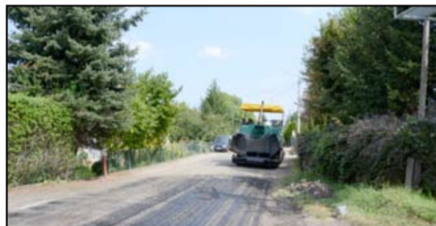
W poprzednim roku zmodernizowane zostały drogi na terenie siedmiu wsi. Standard dróg, w tym roku polepszy się w kolejnych miejscowościach. Budowa nowych dróg kosztować będzie ponad 650 tysięcy złotych.

R uszyły prace związane z remontem dróg dojazdowych do gruntów rolnych. Na razie na odcinku dróg Bożanów-Kalno i Imbramowic. W następnej kolejności czekają jeszcze mieszkańcy Bukowa, Mikoszowej i Łazan. Są to kolejne drogi w gminie Żarów, które doczekają się gruntownej modernizacji.