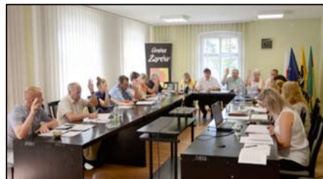
Projekt tej uchwały zaproponowany przez burmistrza został przyjęty jednogłośnie.

Decyzję o nadaniu takich nazw ulicom podjęli żarowscy radni na czwartkowej, 7 sierpnia sesji Rady Miejskiej. – Ulica Fiołkowa to niejako przedłużenie obecnej ulicy Ks. Cembrowskiego , natomiast ulica Różana znajduje się na obszarze między ulicą Słowiańską a Stumetrówką w bezpośrednim sąsiedztwie ulicy Fiołkowej . O takie właśnie nazewnictwo wnioskowali