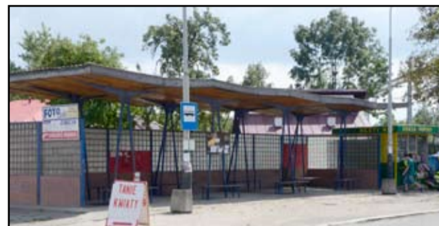
Stara i zniszczona wiata przystankowa już niebawem zniknie z ul. Dworcowej w Żarowie.

Przebudowa ulicy Dworcowej w Żarowie rozpocznie się już jesienią. – Miejsce to znów zrobi się bardziej estetyczne. Udało nam się pozyskać środki finansowe na zakup kostki i obrzeży betonowych i niebawem ruszymy z pierw-