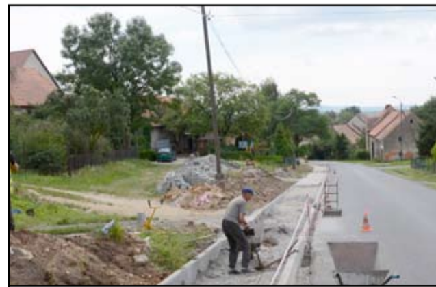
Prace remontowe trwają również przy budowie nowego chodnika w Imbramowicach.