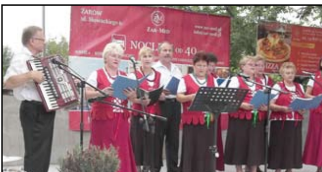
W żarowskim Przeeglądzie Piosenki Ludowej i Biesiadnej wzięło udział prawie 120 osób. Za udane występy, piękne tańce i barwne stroje usłyszeli gromkie brawa. I za odwagę, której nigdy im nie brakuje. Na zdjęciu członkowie Związku Emerytów Rencistów i Inwalidów.

Kolejny Przeegląd Piosenki Ludowej w Żarowie już za rok. Seniorzy jednak obiecali sobie częściej występować w plenerze i organizować recitale muzyczne na nowej scenie. – Cieszę się, że seniorzy w Żarowie są tak aktywni. Pielęgnują ludowe