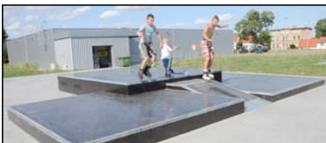
Młodzi Żarowianie zgodnie przyznają, że taki obiekt był w mieście bardzo potrzebny.