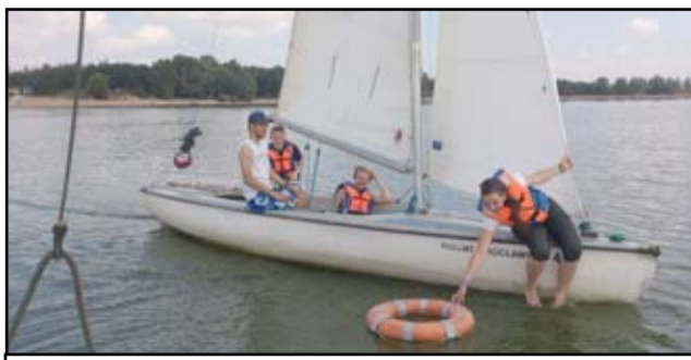
Młodzieżowa Rada Miejska równie ochoczo wspomagała najmłodszych.

Wakacje powoli zbliżają się do końca. Ale najmłodszy mieszkańcy gminy Żarów w pełni korzystają jeszcze z uroków letniego wypoczynku. Po integracyjnych zajęciach świetlicowych, rowerowych wycieczkach i wyjazdach na basen przyszedł czas na wspólne żeglowanie. Pomysł od wielu lat realizuje burmistrz