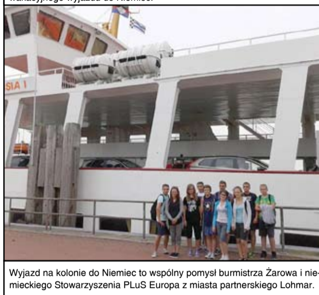
Wyjazd na kolonię do Niemiec to wspólny pomysł burmistrza Żarowa i niemieckiego Stowarzyszenia PLuS Europa z miasta partnerskiego Lohmar.

piękne okolice, poznać różniaków z Niemiec i Francji. Podziękowania należą się również stowarzyszeniu PLuS Europa, naszej wspa-