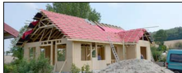
Na terenie budowy nowych świetlic prace idą pełną parą. Tu, na zdjęciu powstający obiekt świetlicy w Pyszczyźnie.

Nowe obiekty wiejskie kosztować będą 817 tysięcy złotych. Część z tych środków finansowych, 148.500 tysięcy złotych to dofinansowanie z Urzędu Marszałkowskiego Województwa Dolnośląskiego, które gmina Żarów pozyskała w ramach Programu Rozwoju Obszarów Wiejskich na lata 2007-2013 „Odnowa i rozwój wsi”.