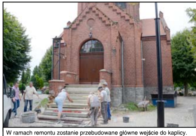
W ramach remontu zostanie przebudowane główne wejście do kaplicy.

Żarowski cmentarz komunalny, estetyczny wi-