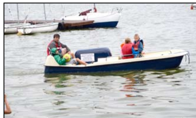
Wyjazdy na żagle to jedna z największych atrakcji dla młodych mieszkańców Żarowa.