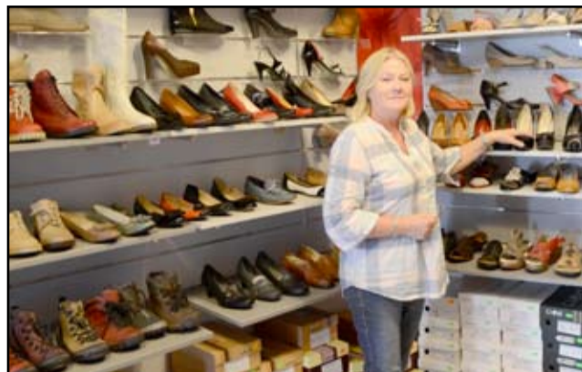
Sklep obuwniczy przy ul. Dworcowej 19 w Żarowie zaprasza klientów od poniedziałku do piątku, w godz. 10.00-18.00, a w soboty od 9.00 do 14.00.

Jaka jest recepta na udany biznes? Żarowscy handlowcy z branży obuwniczej twierdzą, że dobry kontakt z klientem, wiara we własne możliwości i dużo życzliwości. To pomaga, choć nie gwarantuje sukcesu. A ten niespodziewanie może przyjść nawet po wielu latach. Właściciele żarowskich sklepów z obuwiem, choć na terenie Żarowa funkcjonuje ich niewiele, dobrze prosperują. Mają swoich stałych klientów, ale i dobre jakościowo towary.